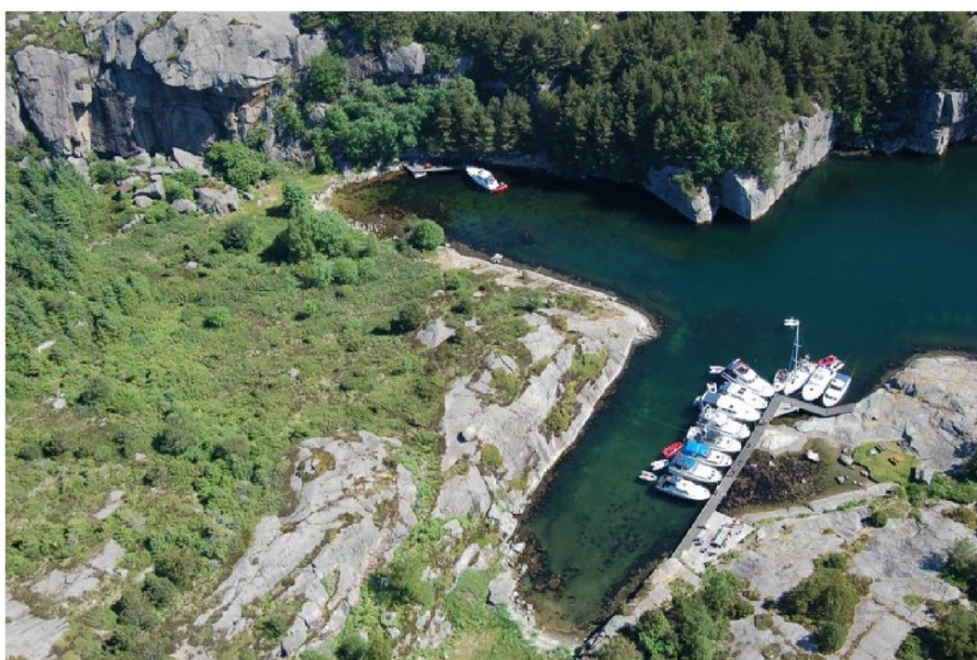
Indre Gyarhavn(til venstre) og ytre Gyarhavn