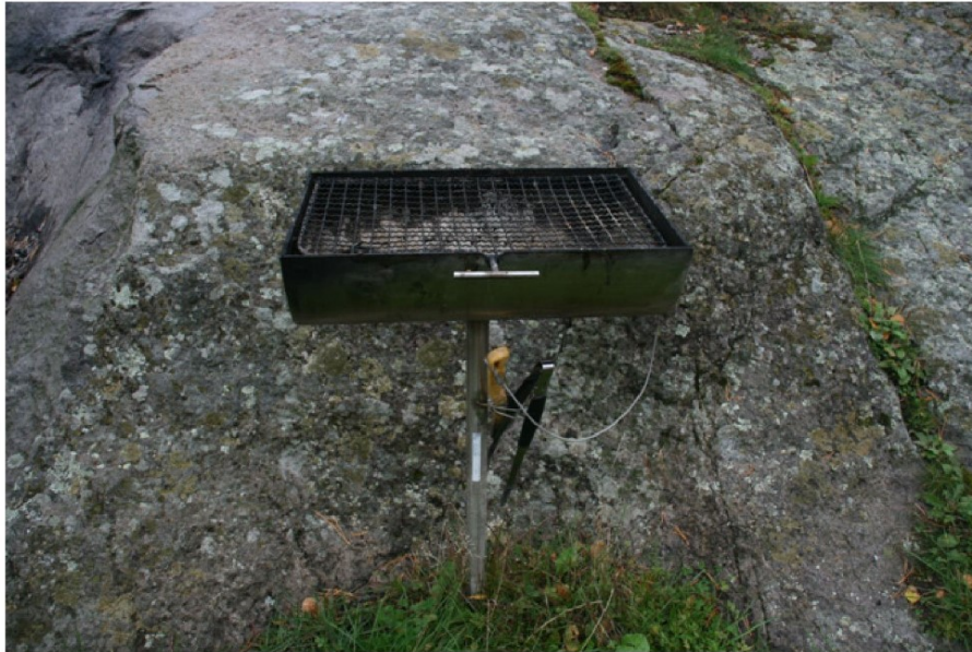
Permanent grill som alle kan bruke.