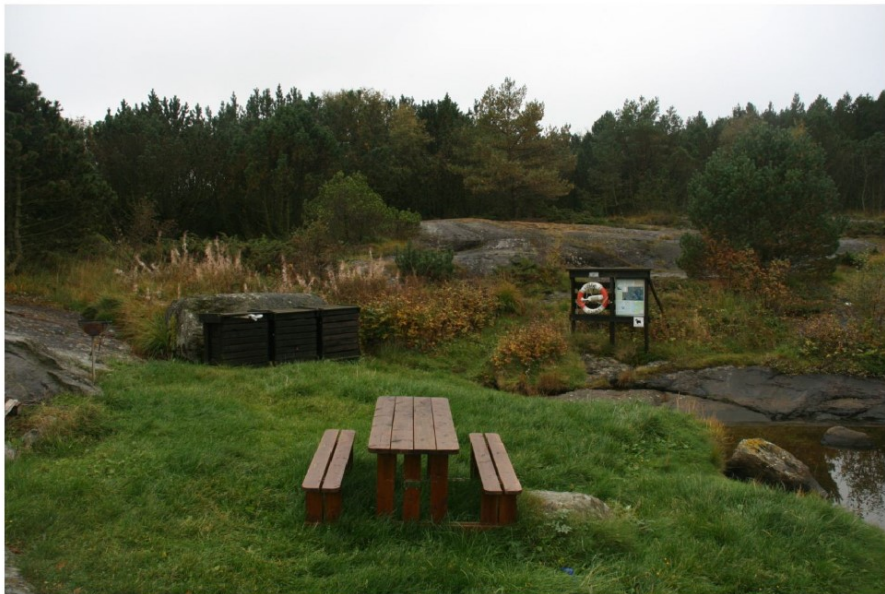
Grillplass ytre Gyarhavn