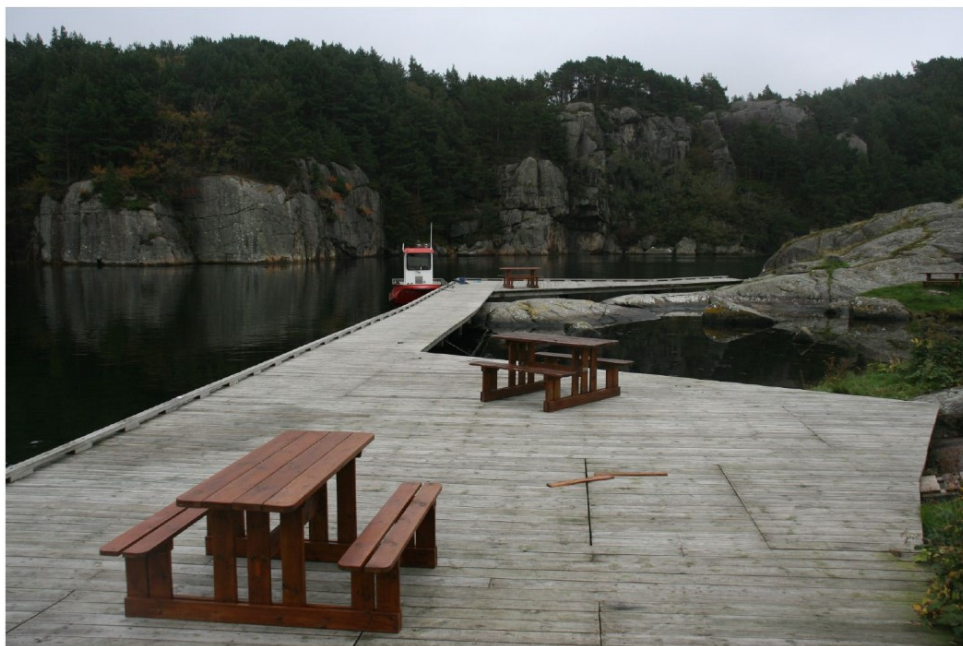
Bryggen i ytre Gyarhavn.