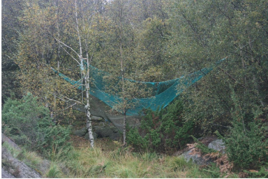
Hengekøy i ytre Gyarhavn