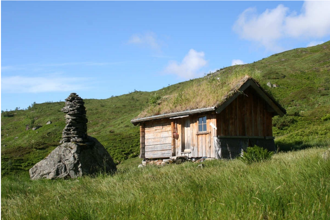
På Hustveitstølen har Friluftsrådet Vest satt opp laftet overnattingshytte etter gammel modell og byggeskikk