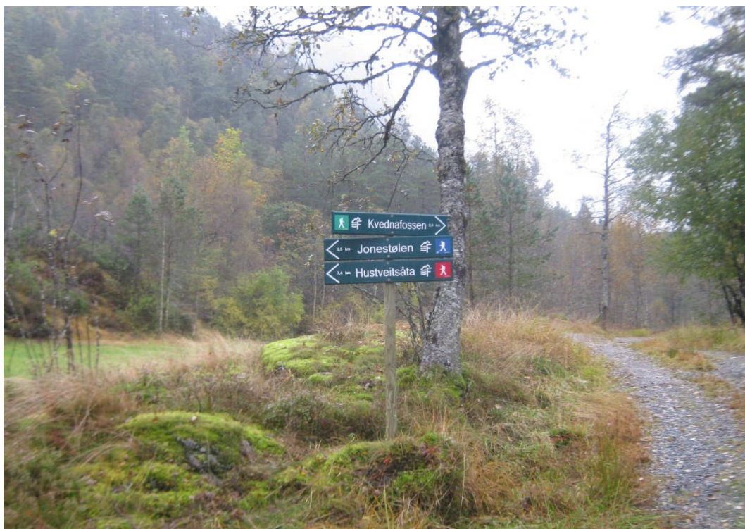
Hustveitområdet byr på mange turmuligheter