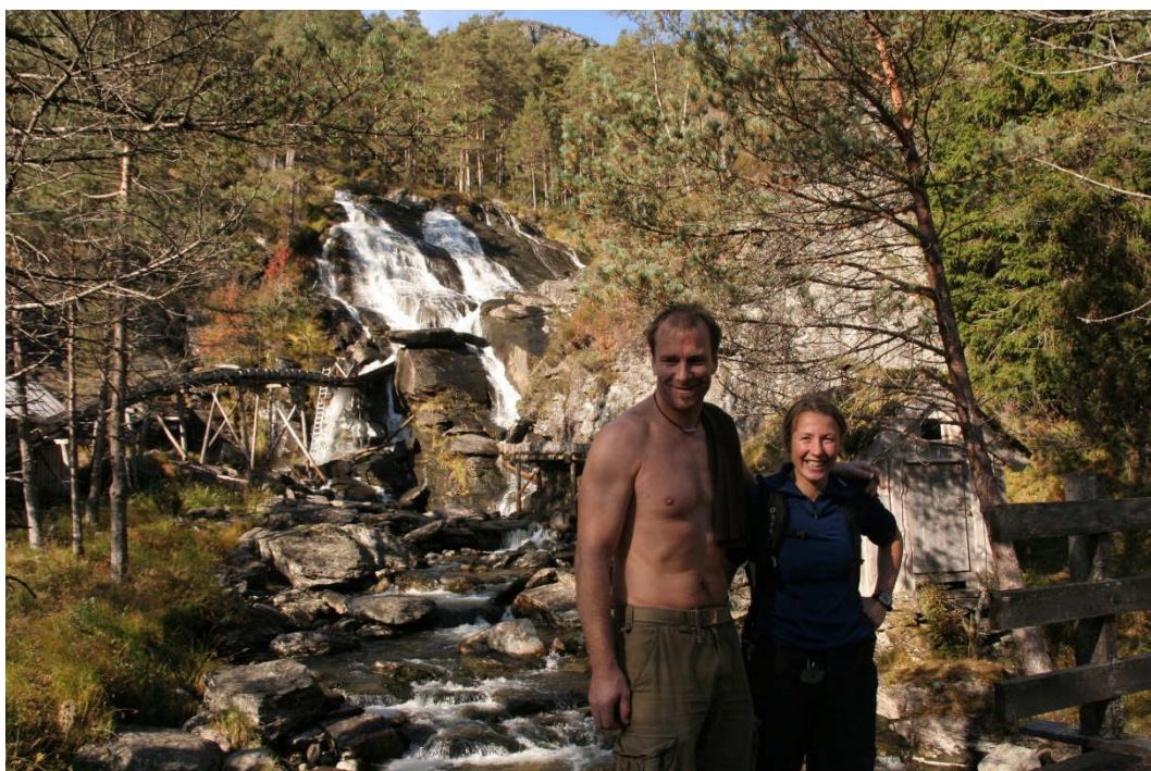
Ved Kvednafossen kan de besøkende oppleve fossefall og restaurert sagbruk