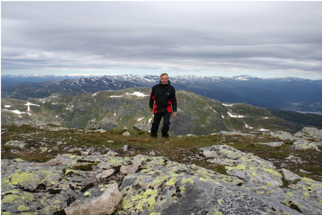
Her har turgåeren funnet vegen helt til topps på Hustveitsåta, 1187 moh