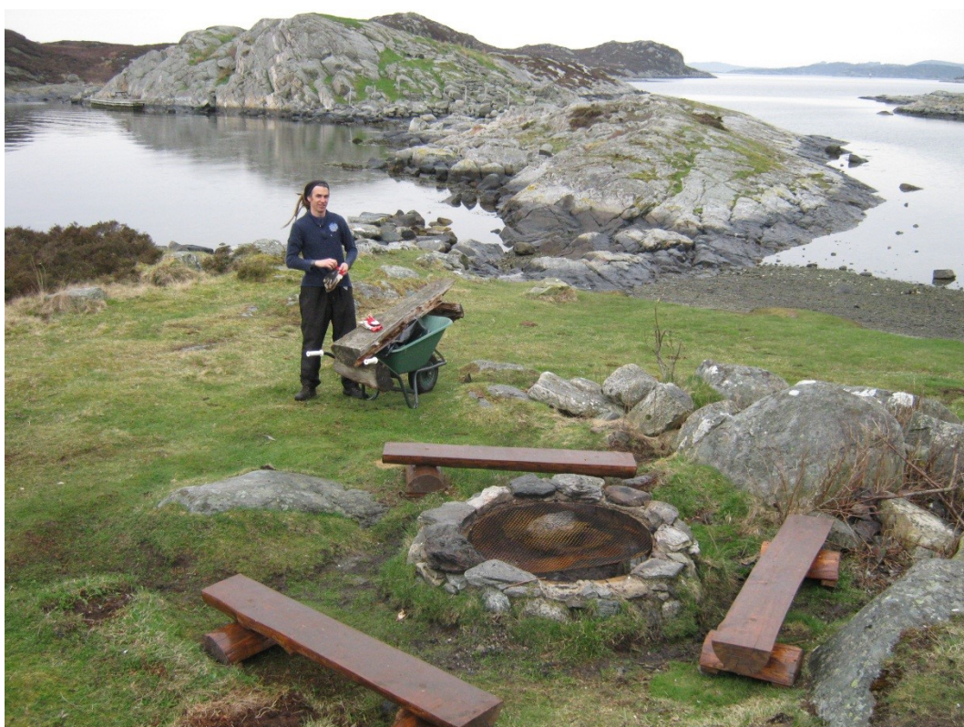
Grillplassen er et viktig samlingspunkt for de besøkende