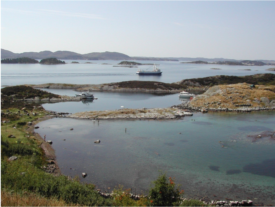
Oversiktsbilde over Ognahabn friluftsområde