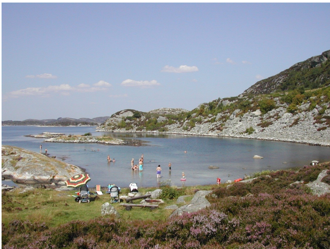
Den langgrunne sandstranda er ideell for de minste