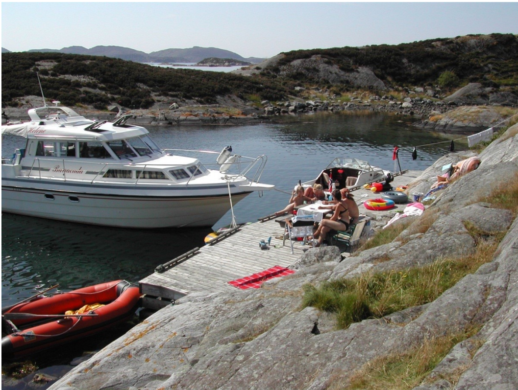
Ognahabn har gjennom mange år vært et viktig båtutfartsområde