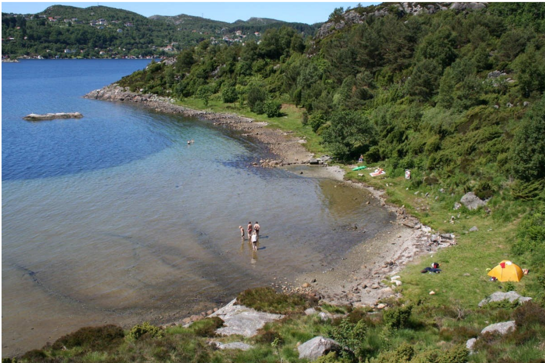
Oversikt over badestranda og baklandet, sett nordover.