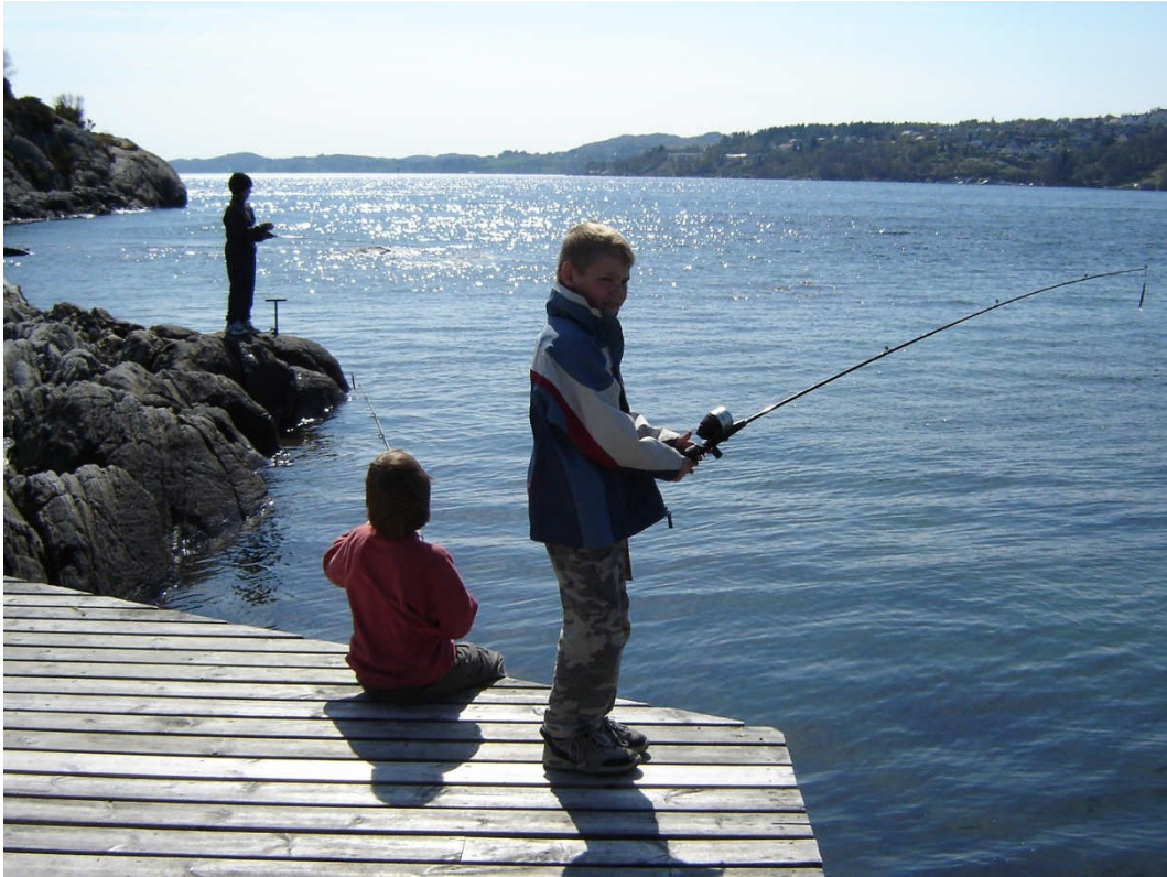
I Dragavika finner du også god trebrygge som ikke minst egner som standplass for stangfiske