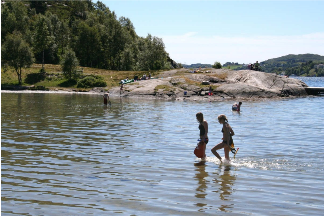
Flott og langgrunn skjellsandstrand i Dragavika