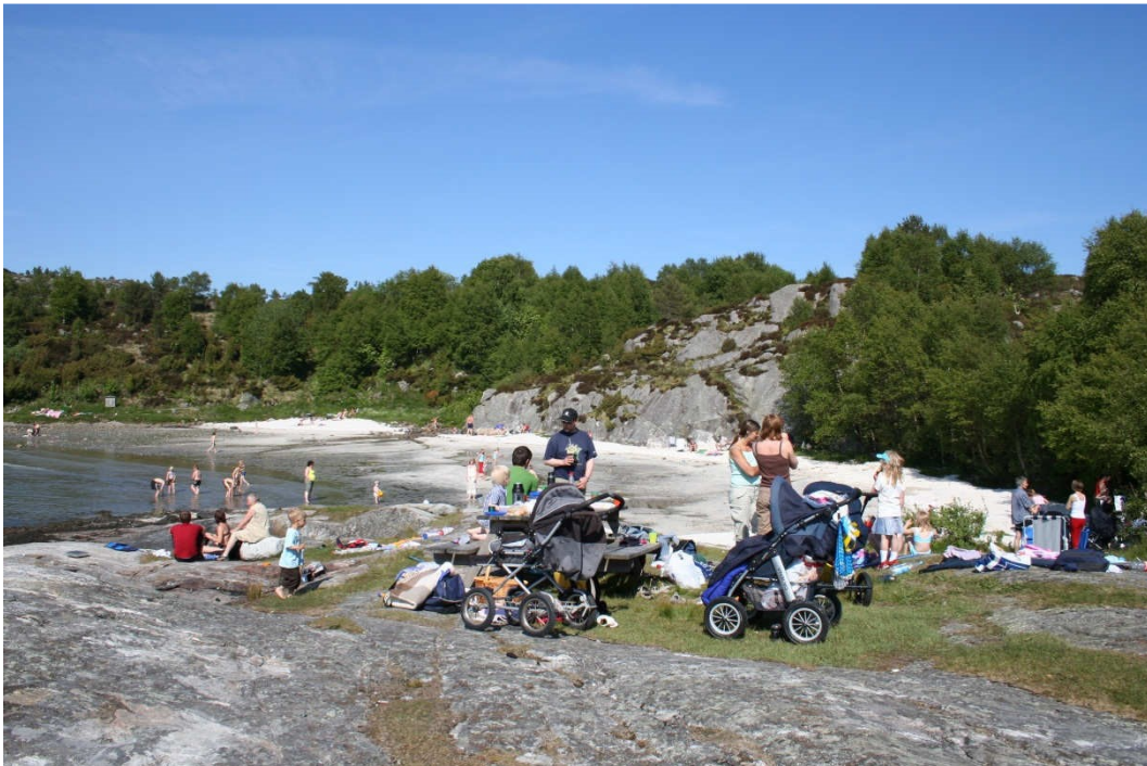
Yrende (bade)liv i Dragavika.