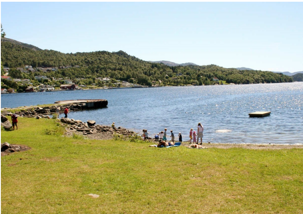
Badestranda på Notaflåt er veldig populær på fine sommerdager