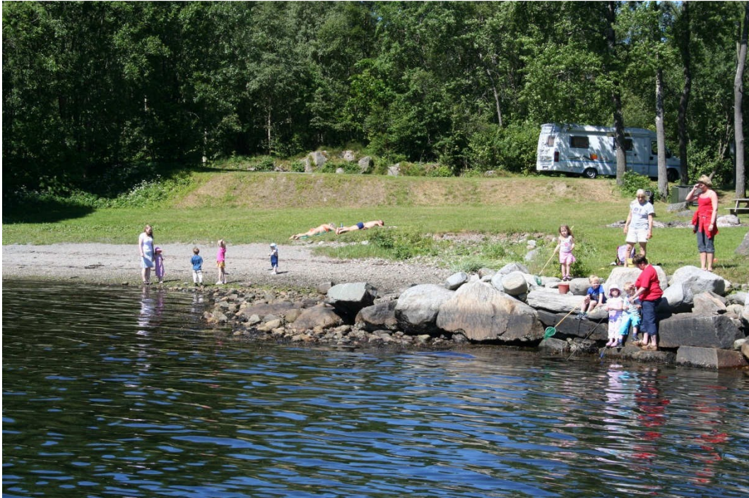
Notaflåt er en ideell plass å studere livet i fjæra