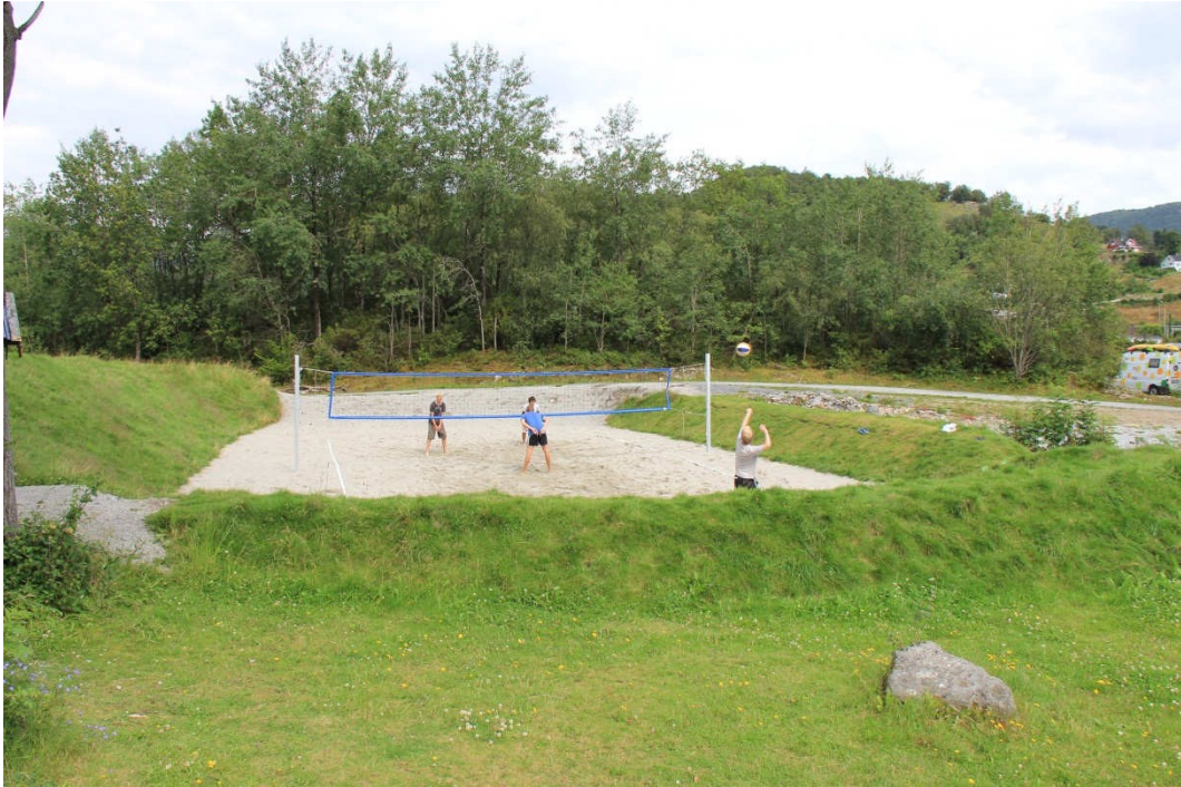
På Notafåt er det også mulig å spille sandvolleyball på ny, flott bane, nedsenket i terrenget.