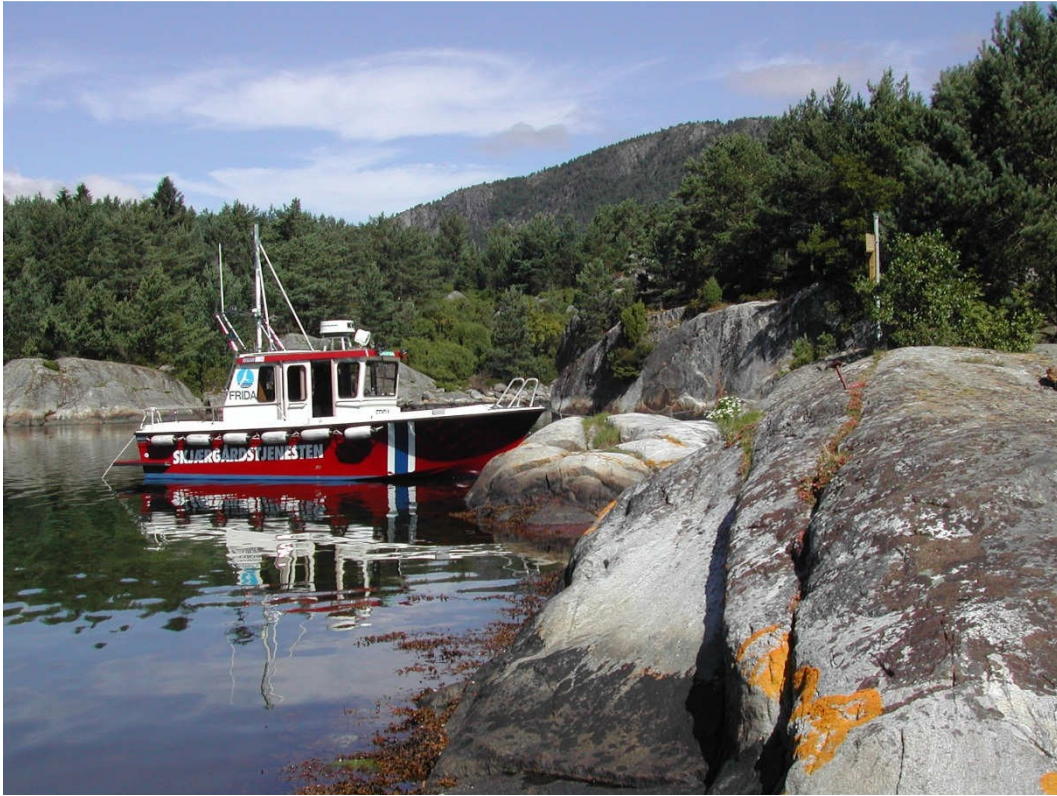
Skjærgårdstjenesten på besøk ved Ringtveitsholmen, Espevik