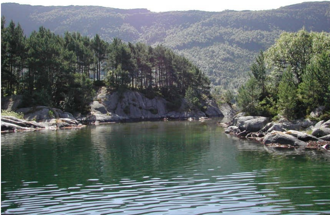
Flotte svaberg og duftende furuskog møter båtfolket