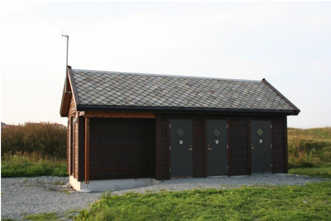
Nytt servicebygg med tre toalett, der det ene er satt av til funksjonshemmede. På enden av bygget er det også satt opp utedusj.