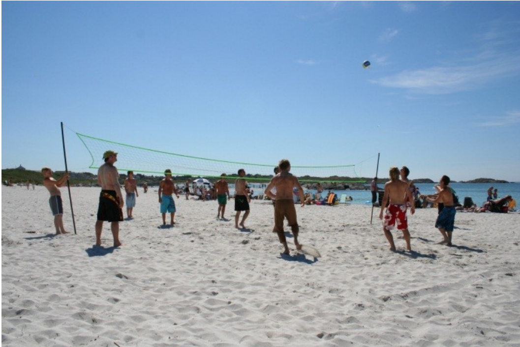
Åkrasanden er et samlingspunkt for utøvelsen av en rekke friluftaktiviteter