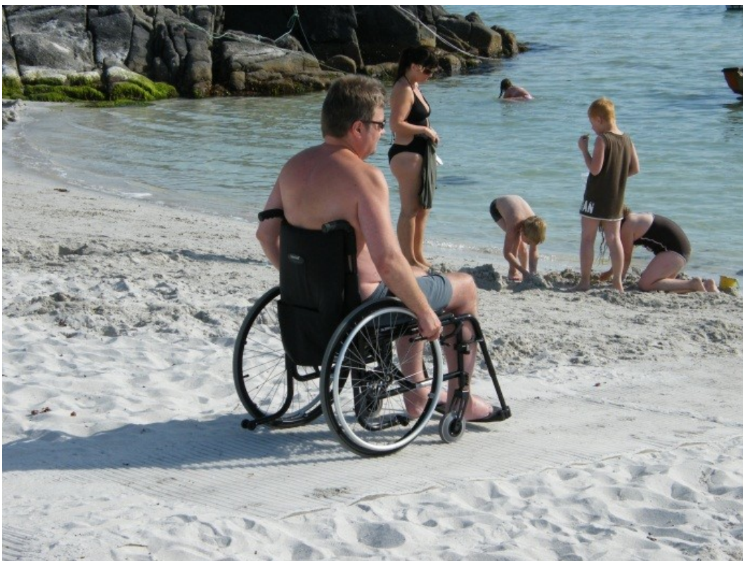
I badesesongen legges det ut såkalte mobimatter for å bedre framkommeligheten for rullestoler, barnevogner, m.fl.