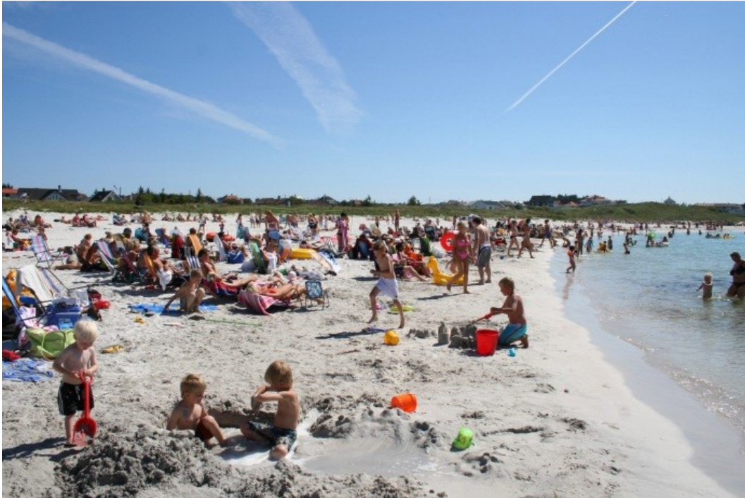
Høytrykk på Medhaugsanden