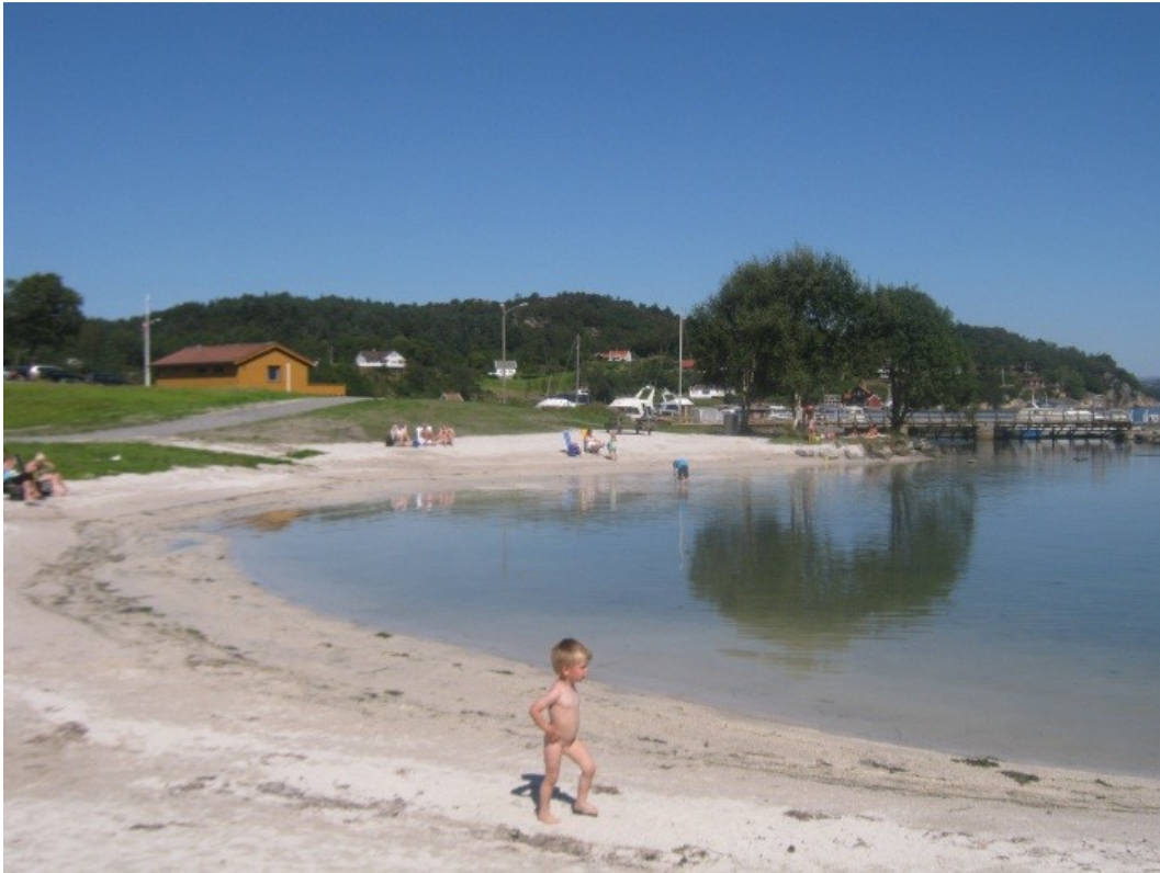
Makkavika har blitt kraftig oppgradert i løpet av 2012, bl. a. med ny tilkomst/turveg, utvidet badestrand (påført skjellsand) og sandvolleyballbane.