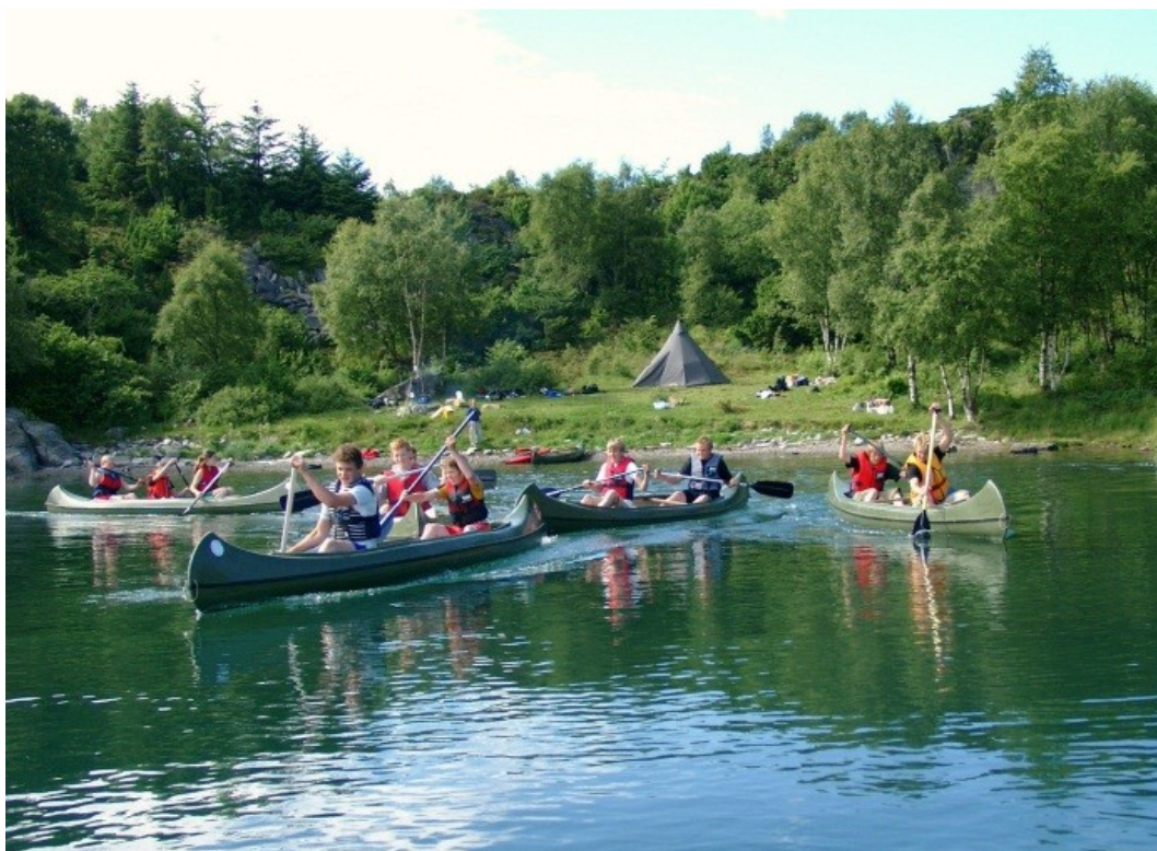
Storevik, sør på Lindøy, blir mye brukt til leirslagning og sjørettet aktivitet, f. eks. padling