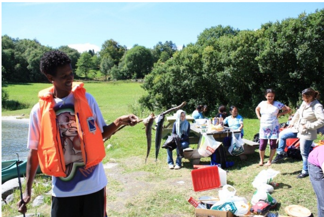
Ei gruppe nye landsmenn har her aktivitetsdag med fiske, bading og padling i Makkavika