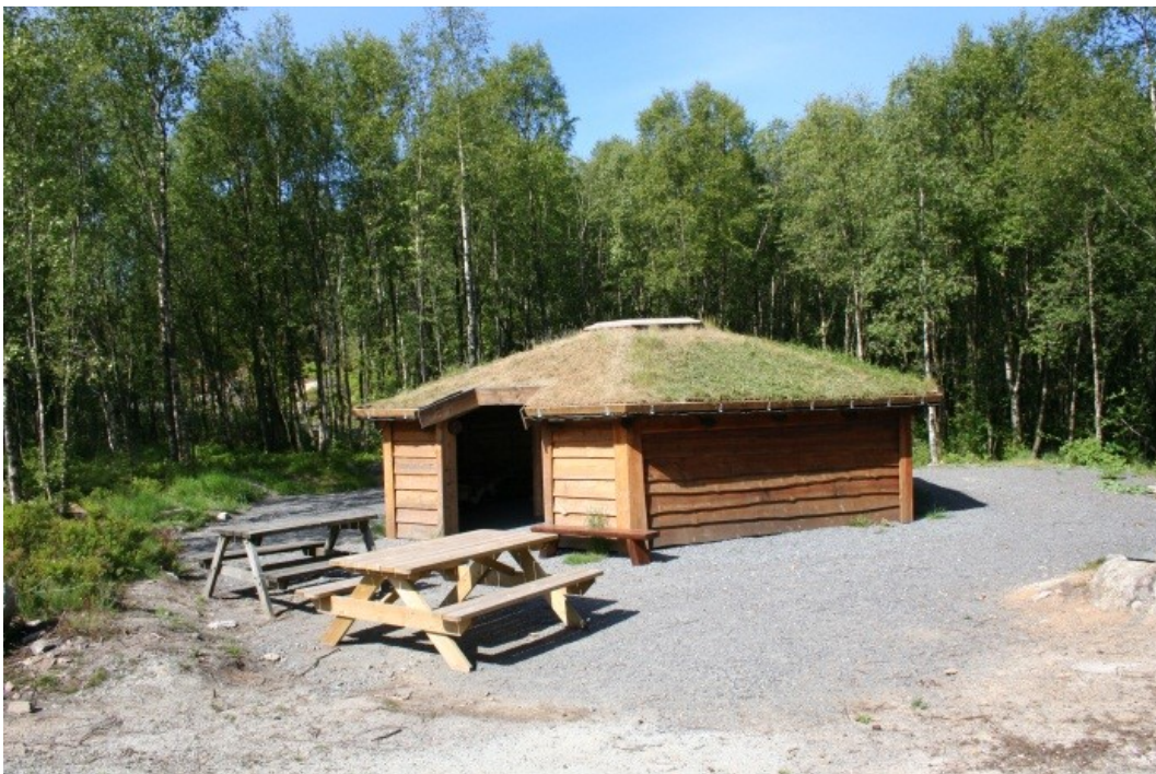
Gapahuken er en populær samlingsplass for lag og foreninger, og andre på tur...