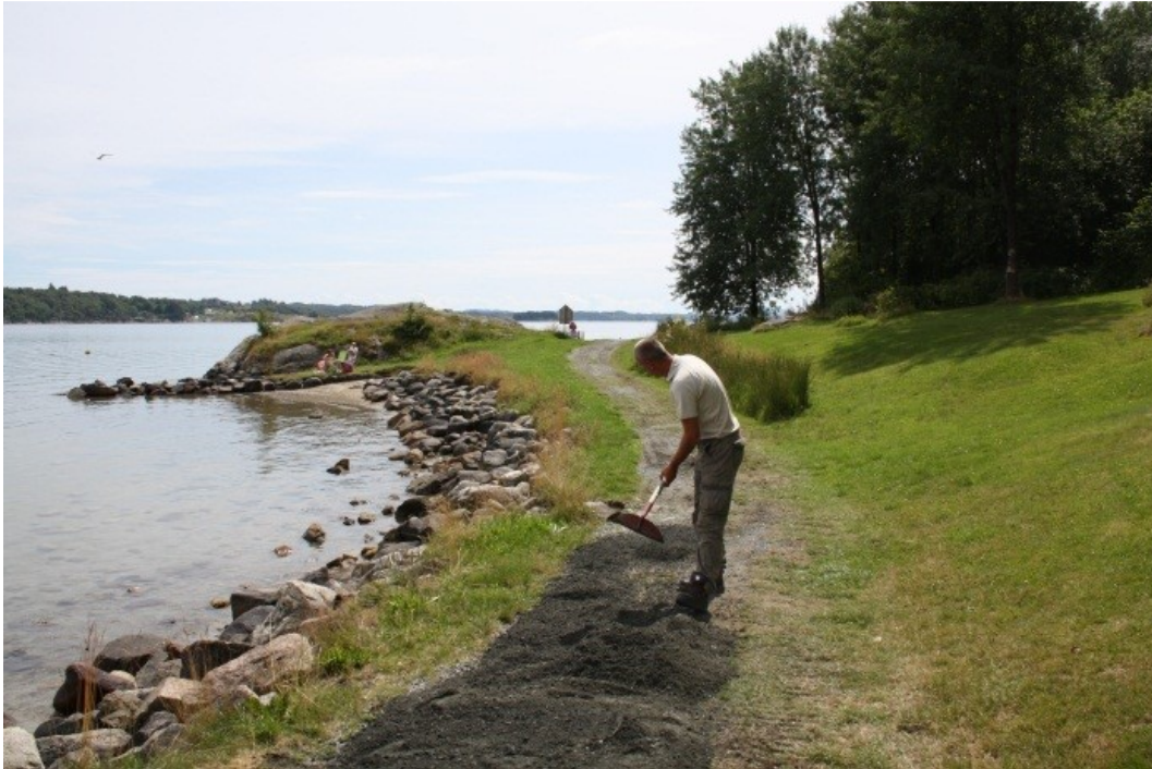
Turvegen gjennom området trenger jevnt vedlikehold