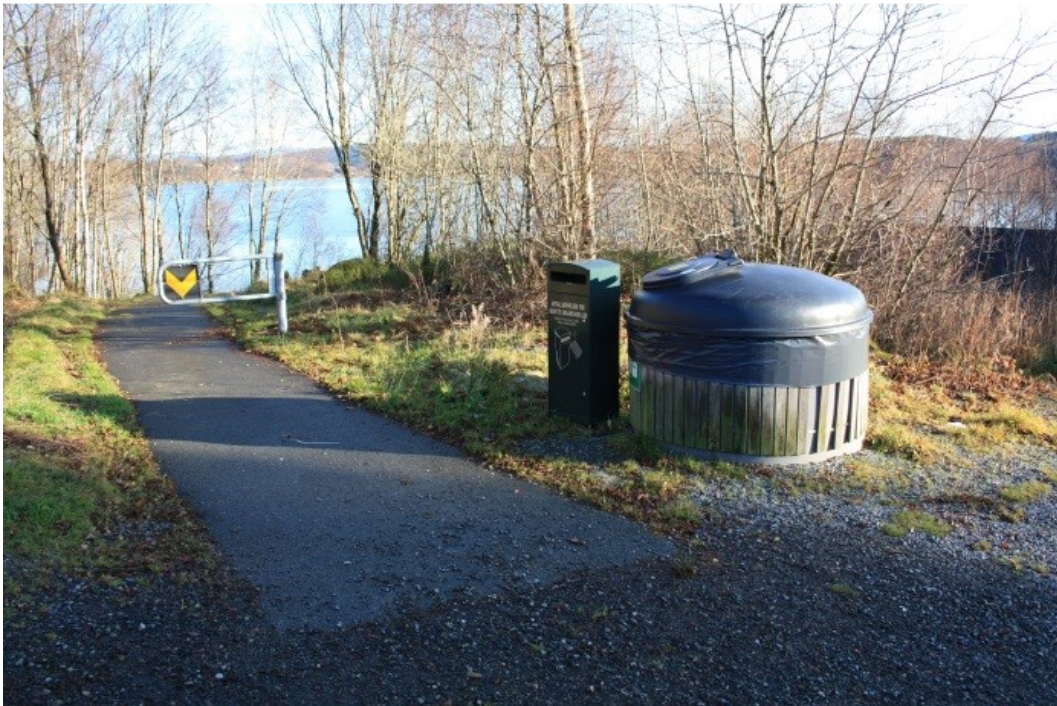
Ved parkeringsplassen er det gravd ned søppelstasjon (molok).