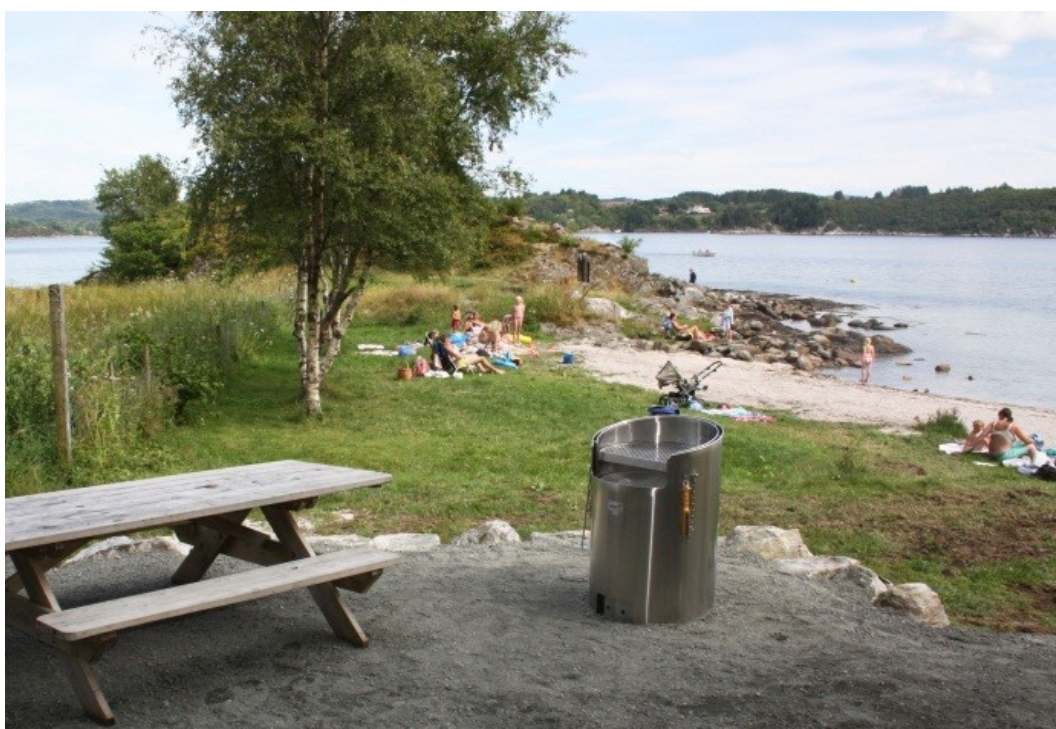
Ved sandstranda er det også anlagt rasteplass med fast grill og bordbenk.