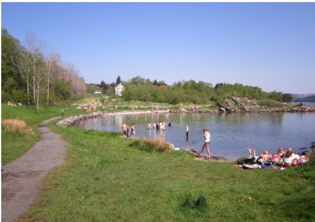
Yrende badeliv ved Aksnesstranda