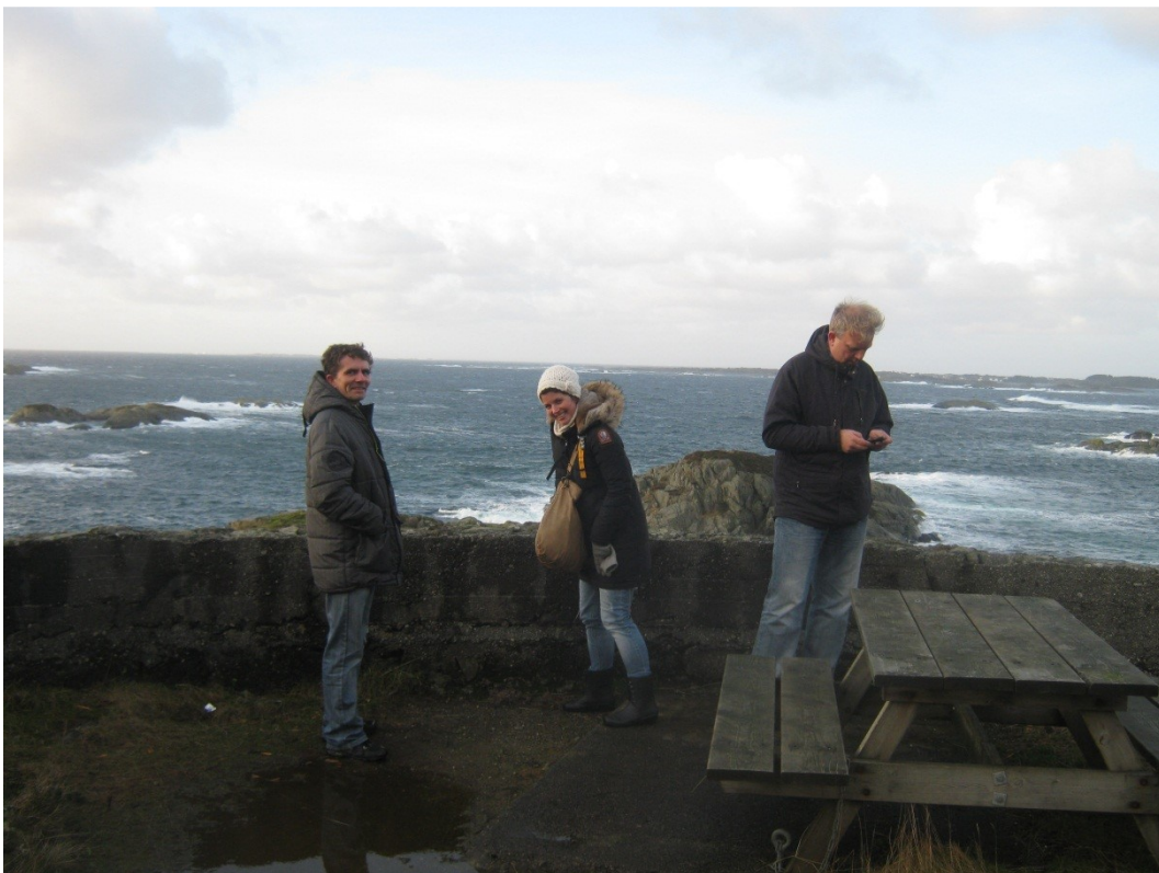
Utsiktsplatå på bunkers fra andre verdenskrig