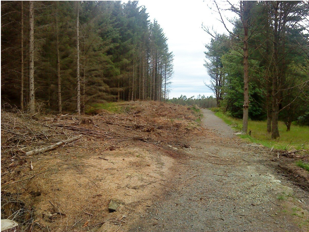
Parti fra ridestiene etter at det er foretatt hogst i granskogen