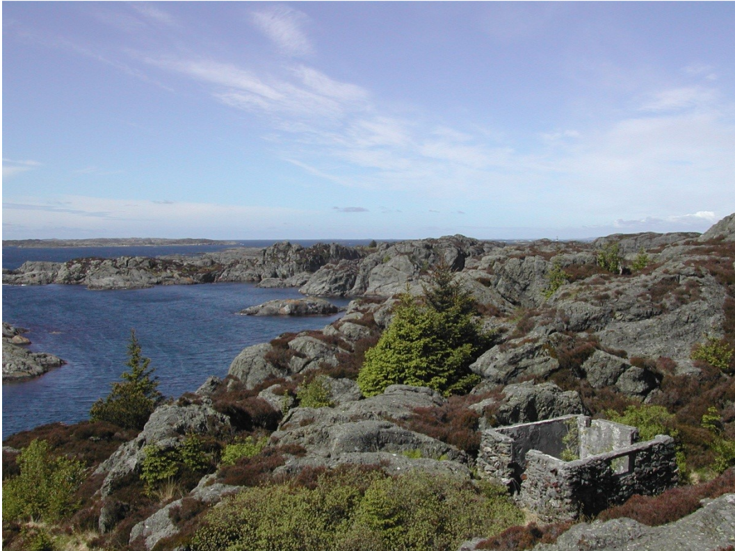
Fra vestlig del av ridestiene får du flott utsikt over Karmøys vestkyst og storhavet utenfor