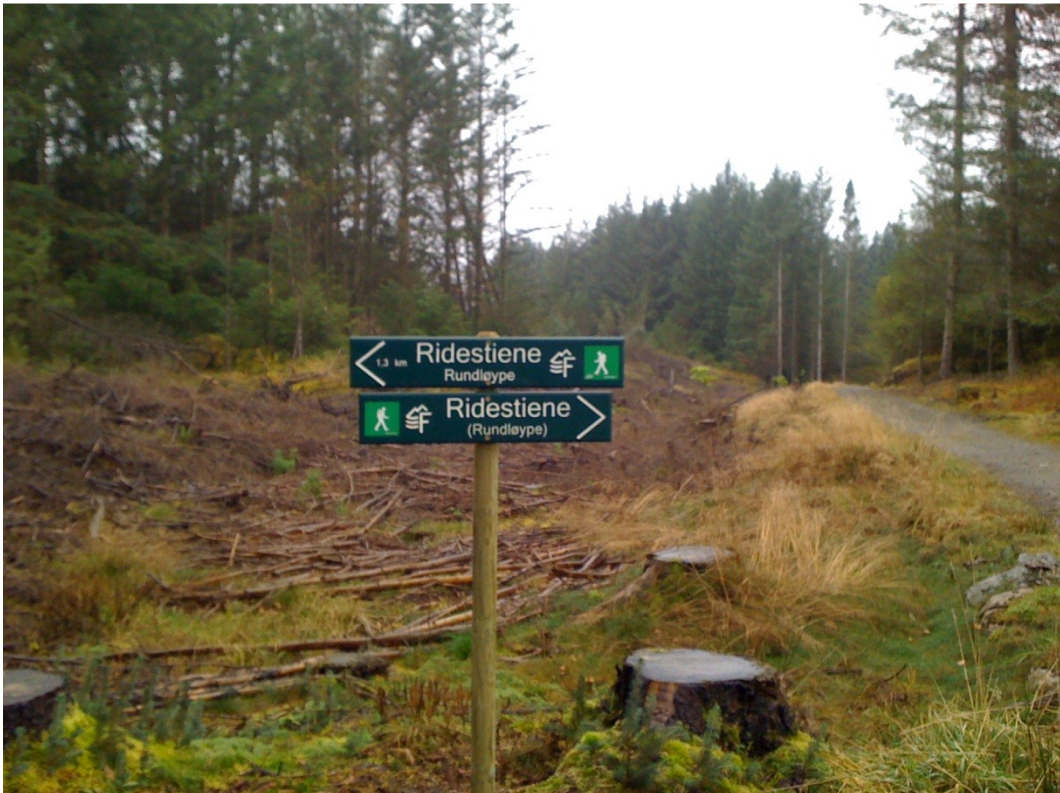
I 2012 ble det foretatt ny skilting og merking i området, etter ny nasjonal standard