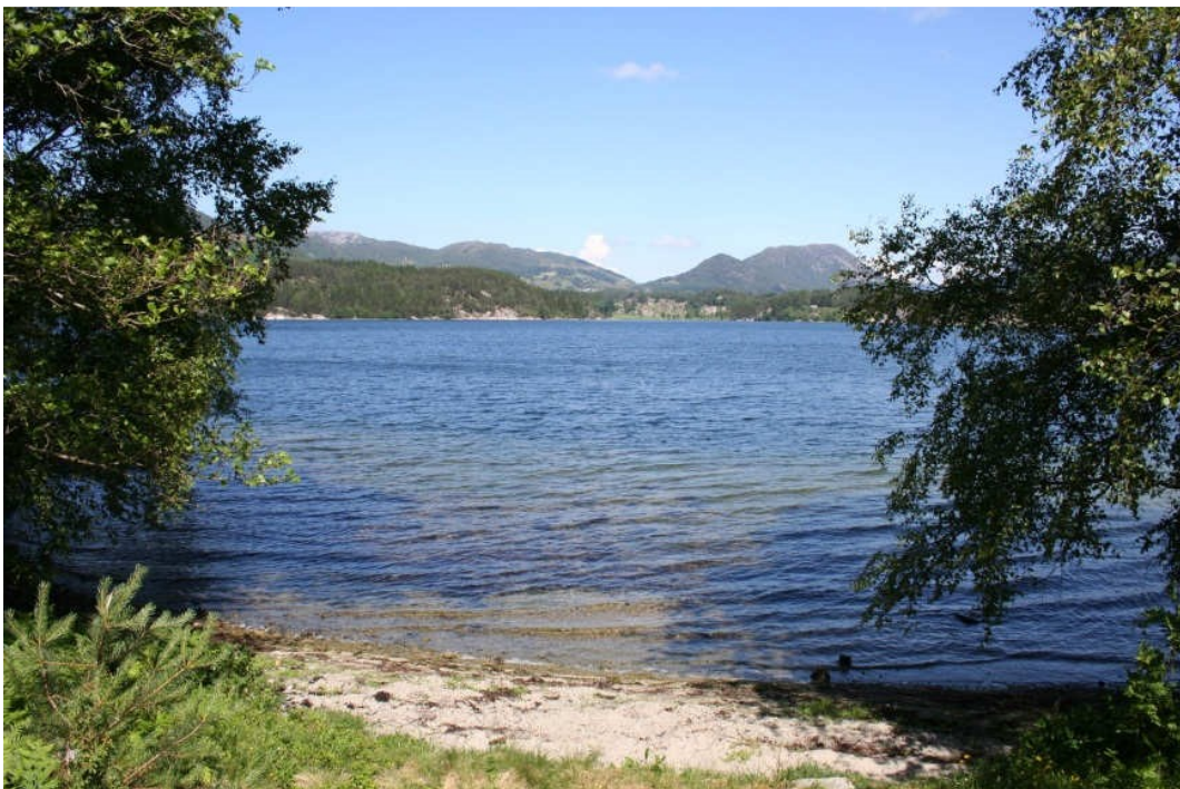
Utsikt nordover mot Skjold