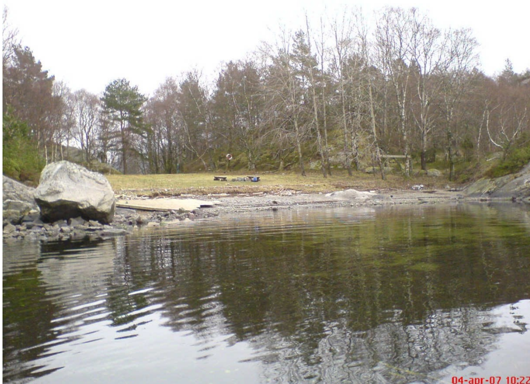
Parti fra badestranda mot sørvest