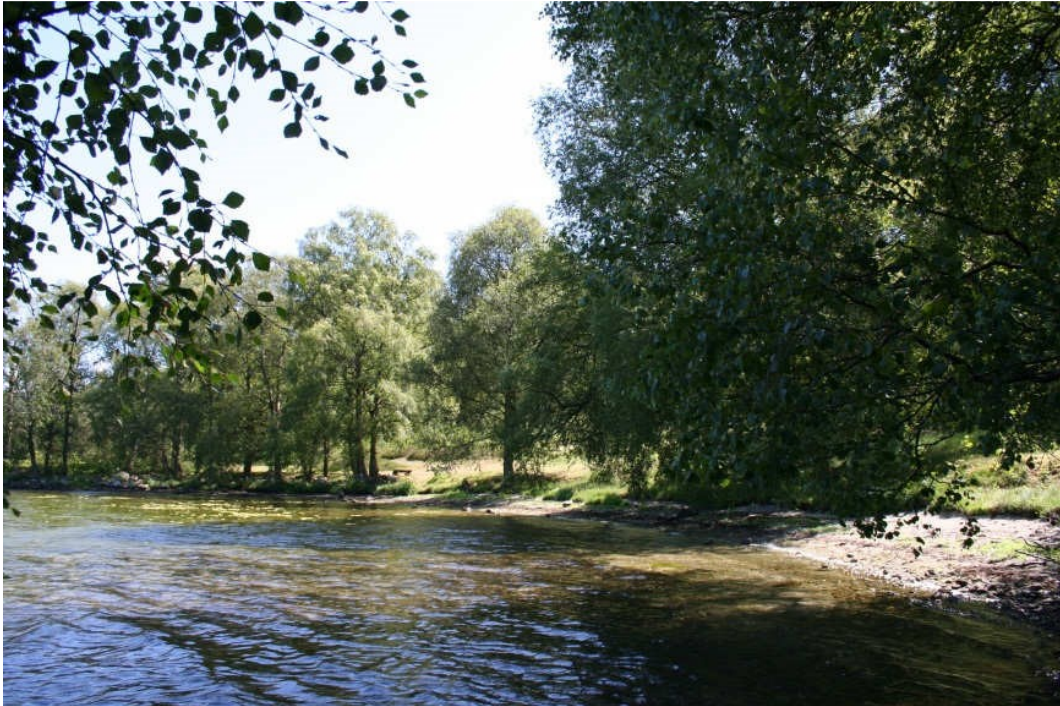
Otertong er et av de mest fredelige friluftsområdene vi har.