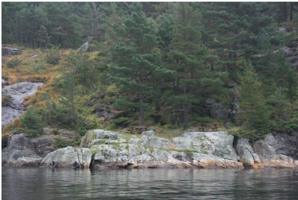
På motsatt side av bukta er det tilrettelagt med bord, pullerter og dekk til fortøyning.