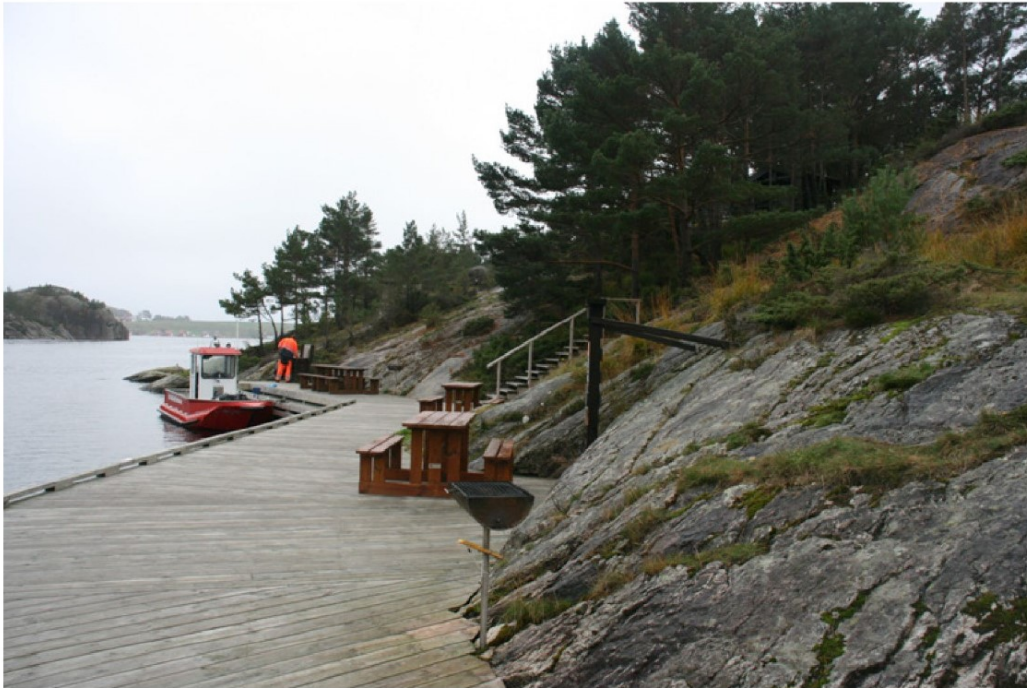
Brygge med bord, grill og renovasjon. Toalettuset skimtes i skogen oppe til høyre.