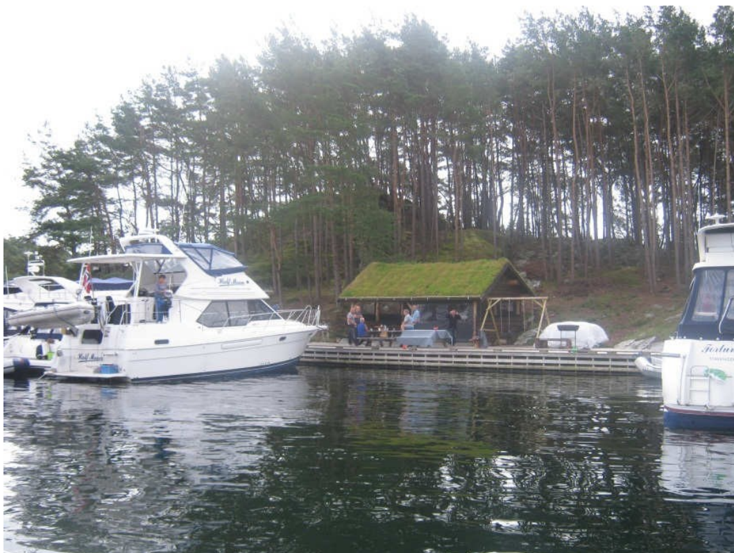
Stor trebrygge, flytebrygge og grillhus på sørsida av lagunen