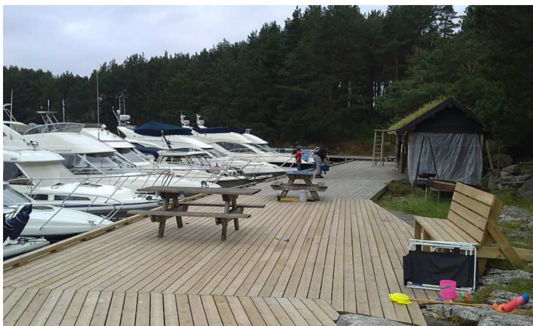
På nordsida er det også stor trebrygge, grillhus, lekeapparater og sandstrand