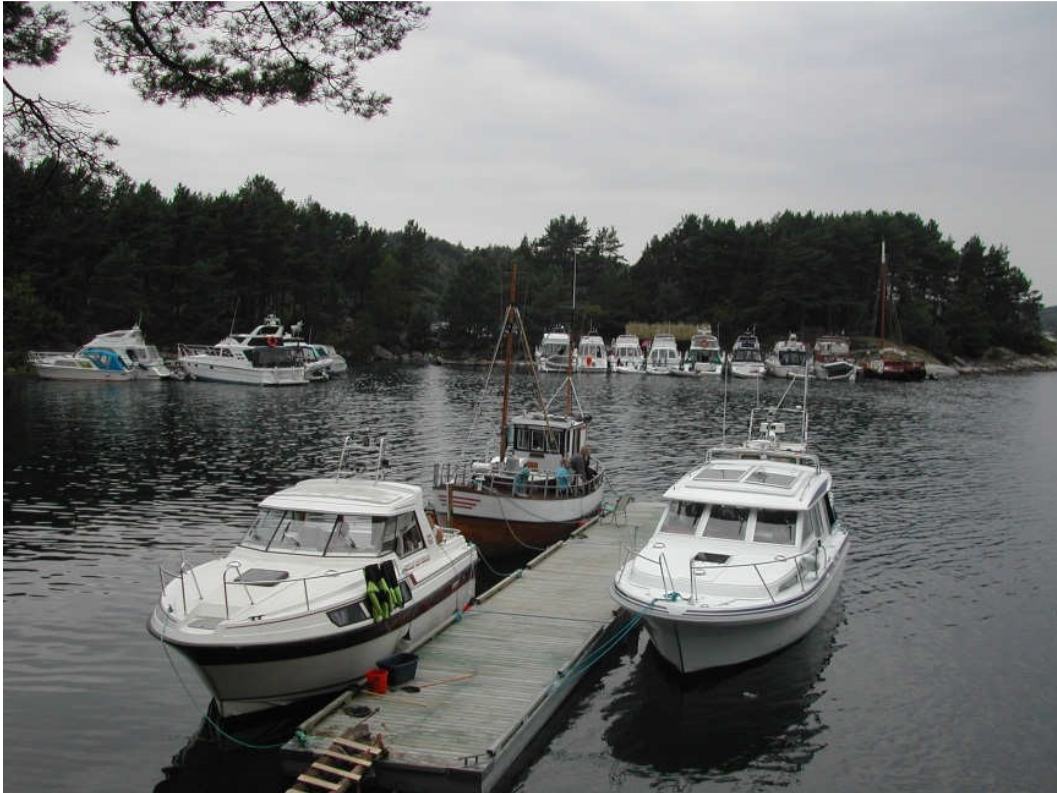
Hamnaren er et av de viktigste samlingspunktene for båtfolket i regionen