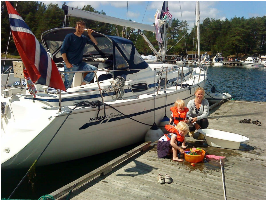
På Hamneren trives både store og små...