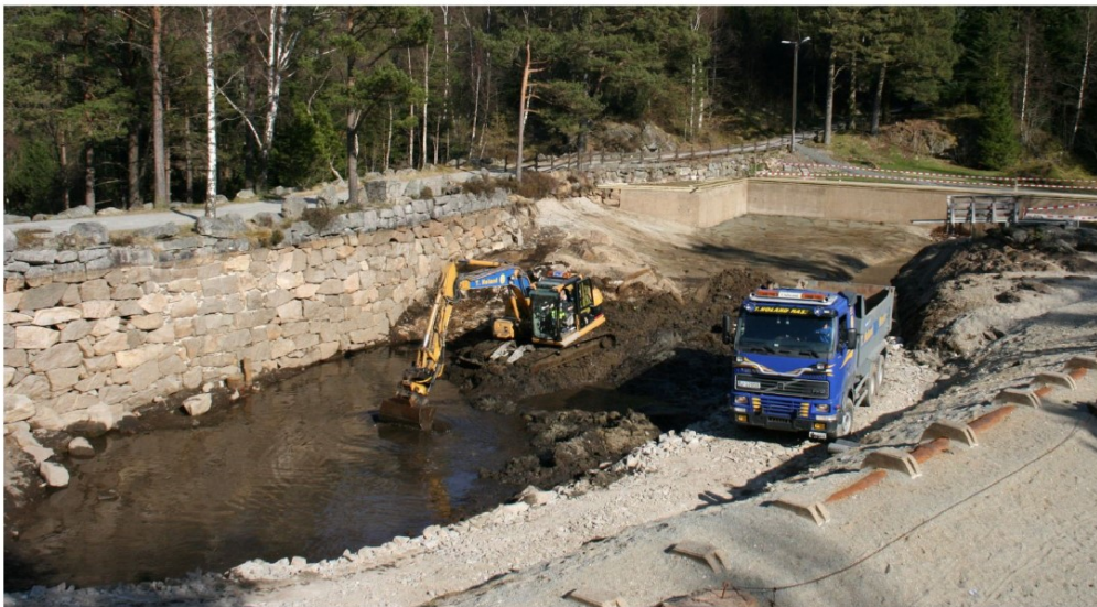
Ca annethvert år utføres det rensearbeid og fjerning av slam i bassenget.