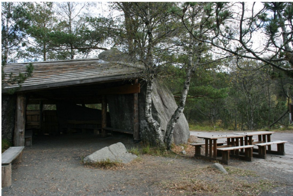
Gapahuk ved Låvaberget