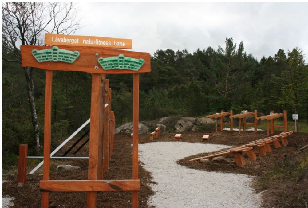
Utendørs "treningscenter" opparbeidet av Dalane Friluftsråd.