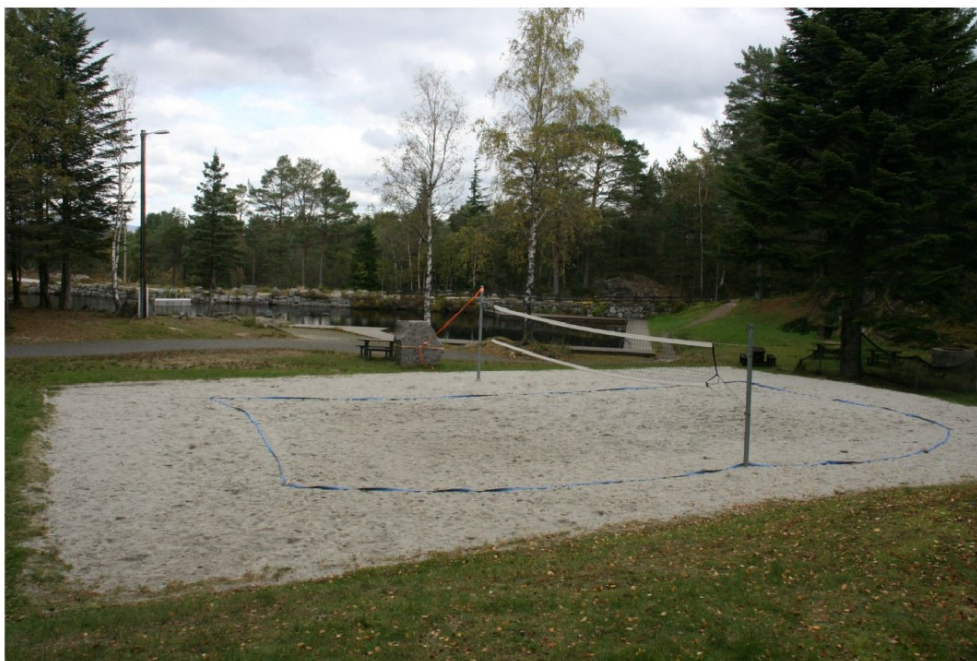
Sandvolleyballbane ved første vannbasseng. Stanga til venstre må festes på nytt.