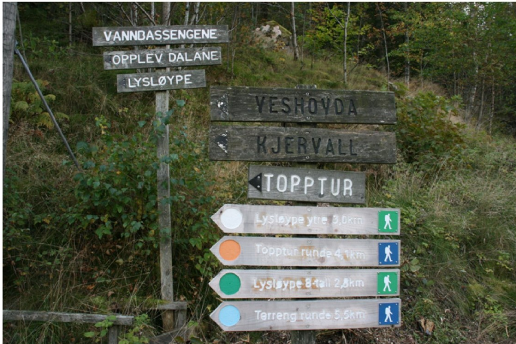
Området har et stort utvalg av turløyper, inkludert lysløype.