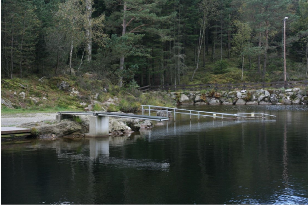
Stupebrett og rekkverk for funksjonshemmede.