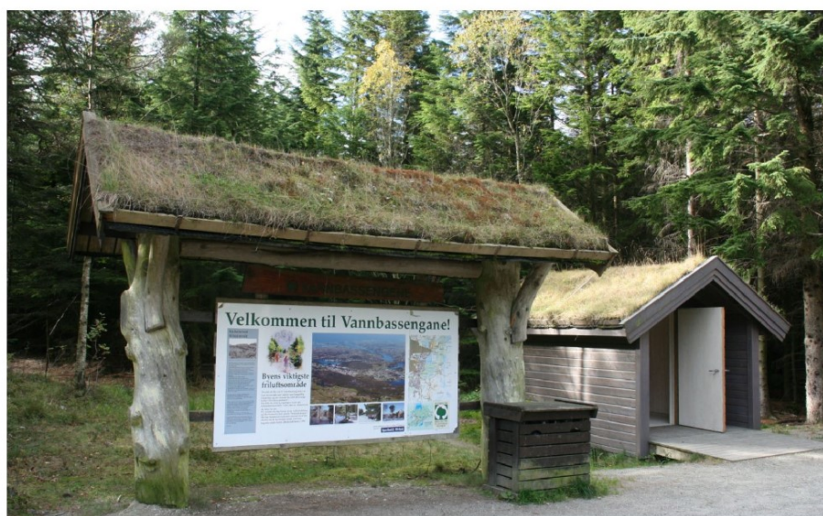
Infoskilt og toalettus ved første vannbasseng.