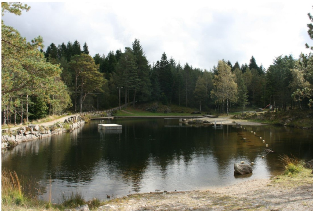
Første vannbassen, en populær bade plass og et av de mest brukte områdene.