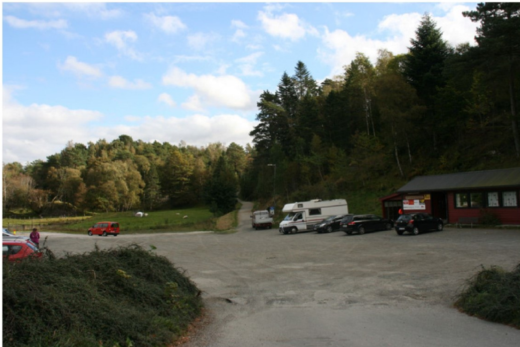
Parkeringsplassen. Lokalet til høyre disponeres av Egersund O-klubb.