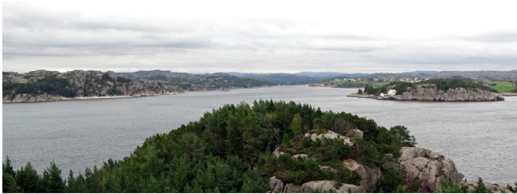
Utsikt innover i Norda-sundet fra toppen av Horsholmen.