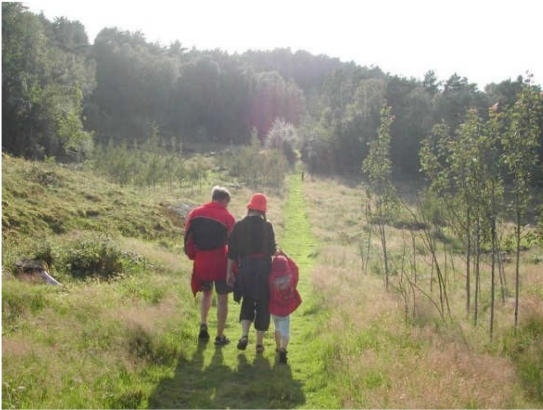
Flott turterreng på alle Romsøyene