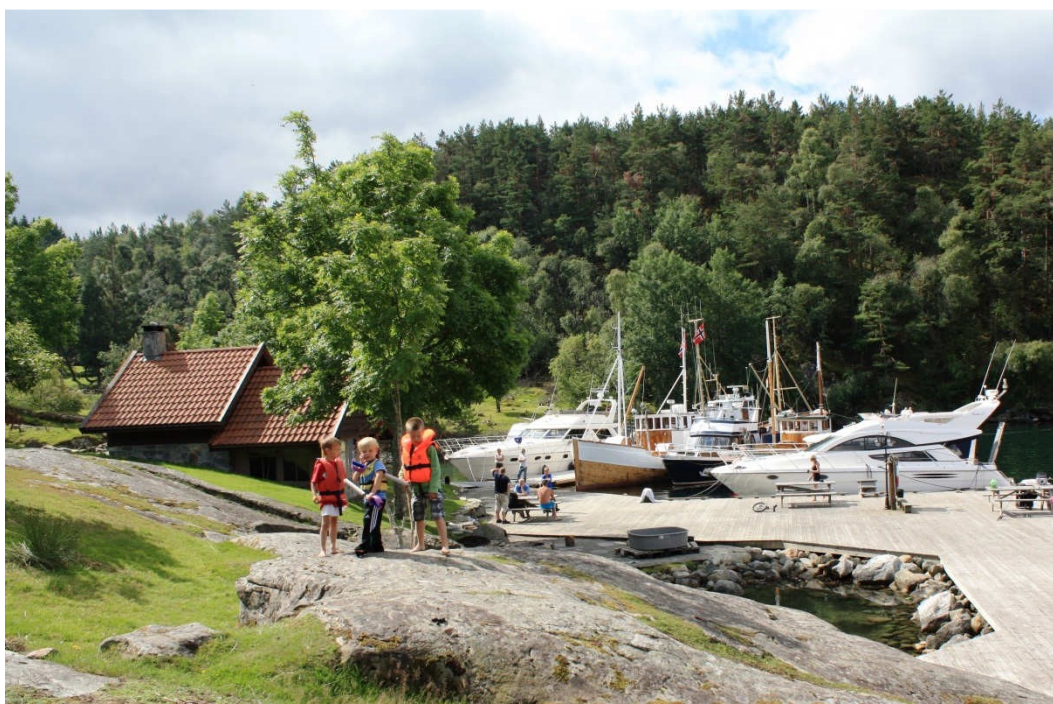
Romsa er kanskje det mest spennende og mest populære båtutfartsområdet i regionen