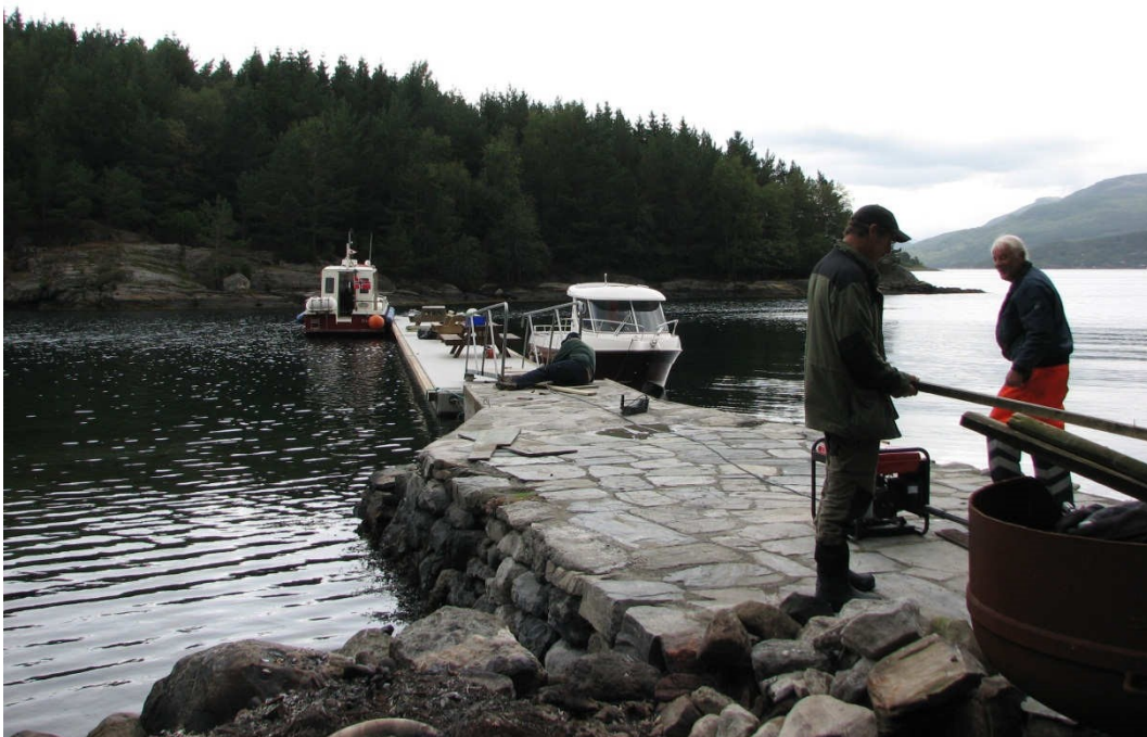
Dugnadsarbeid i forbindelse med ny flytebrygge på Herøy