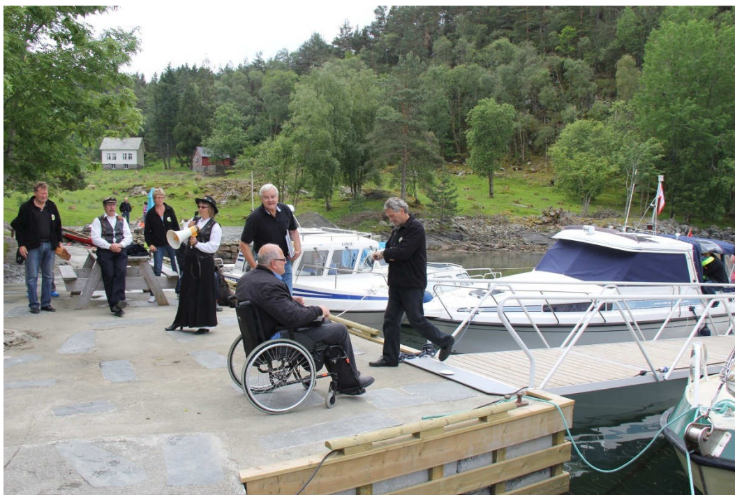
I Grindanesvika har den nye flytebrygga universell utforming