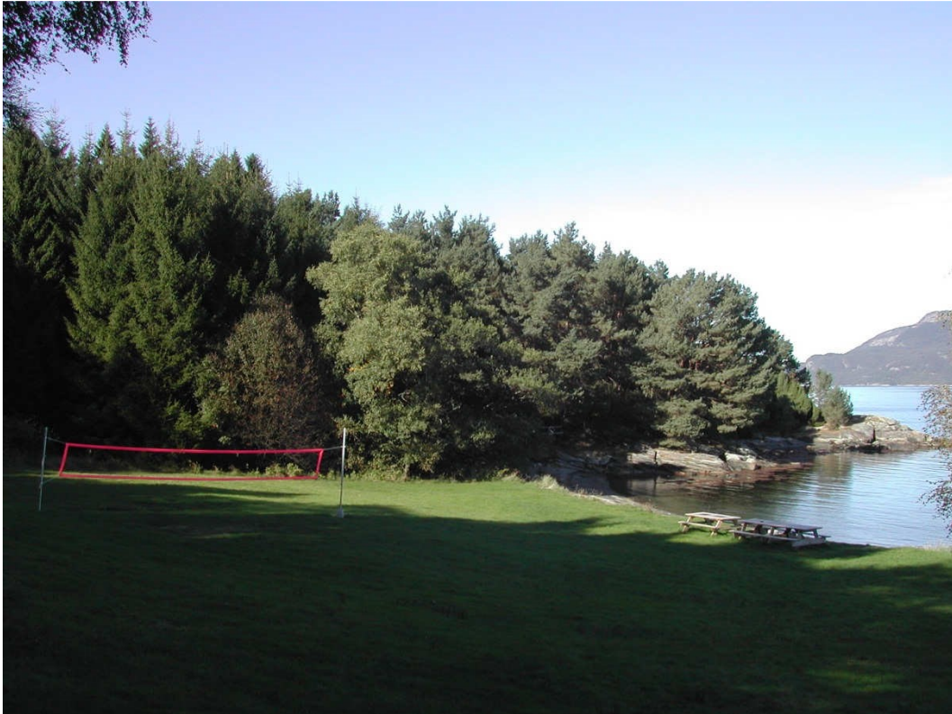
Den store grassletta i Vedvika innbyr til ballspill. Volleyballnettet står oppe året rundt...