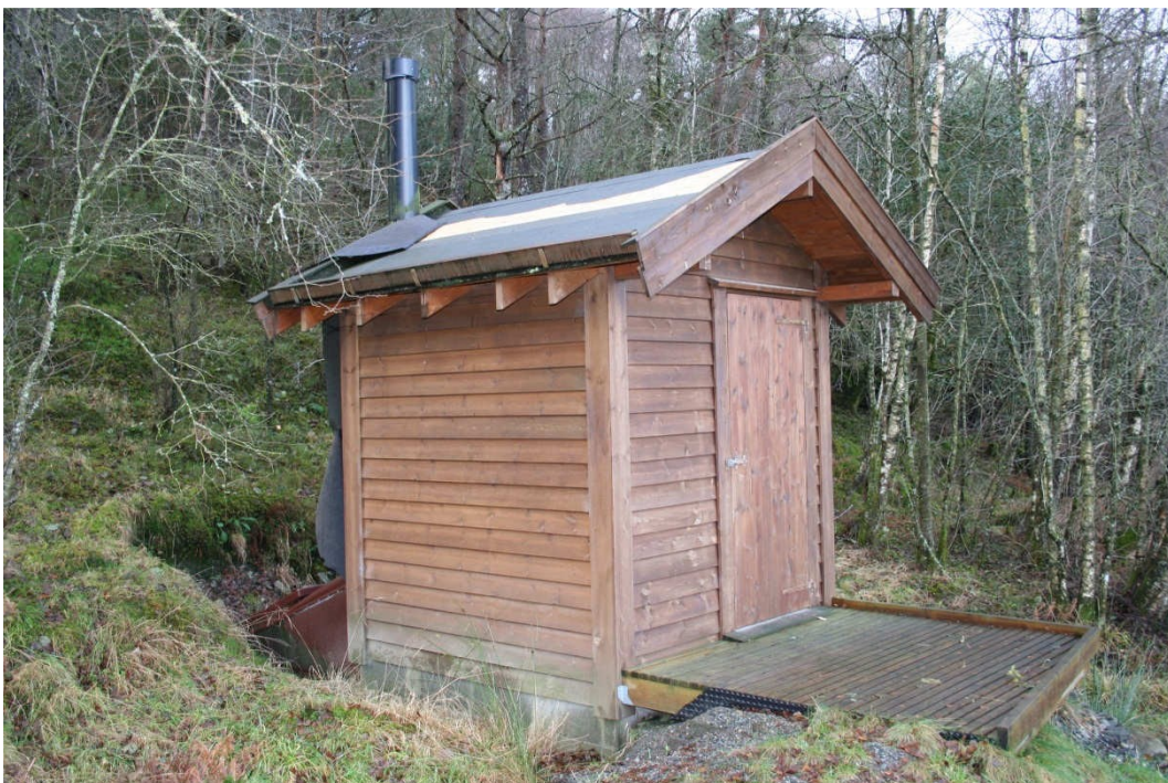
En enkel utedo kan også gjøre nytten...