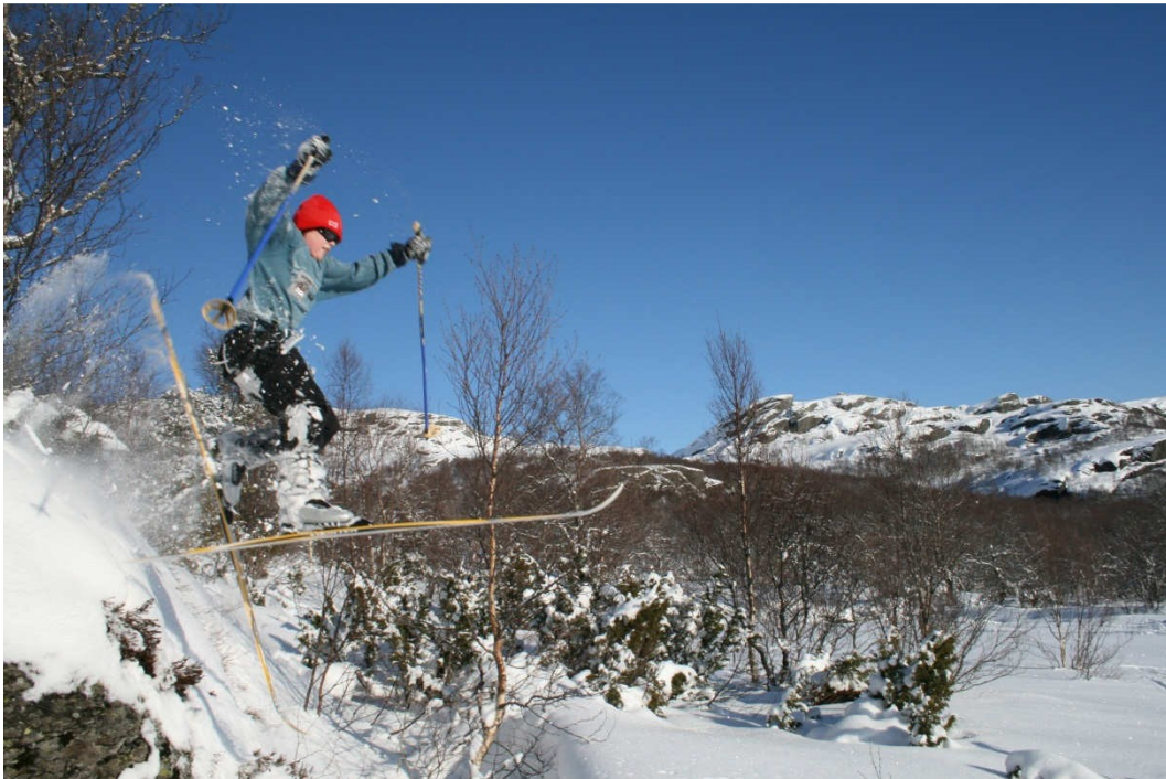
Ungt vågemot setter utfor de bratteste bakker...