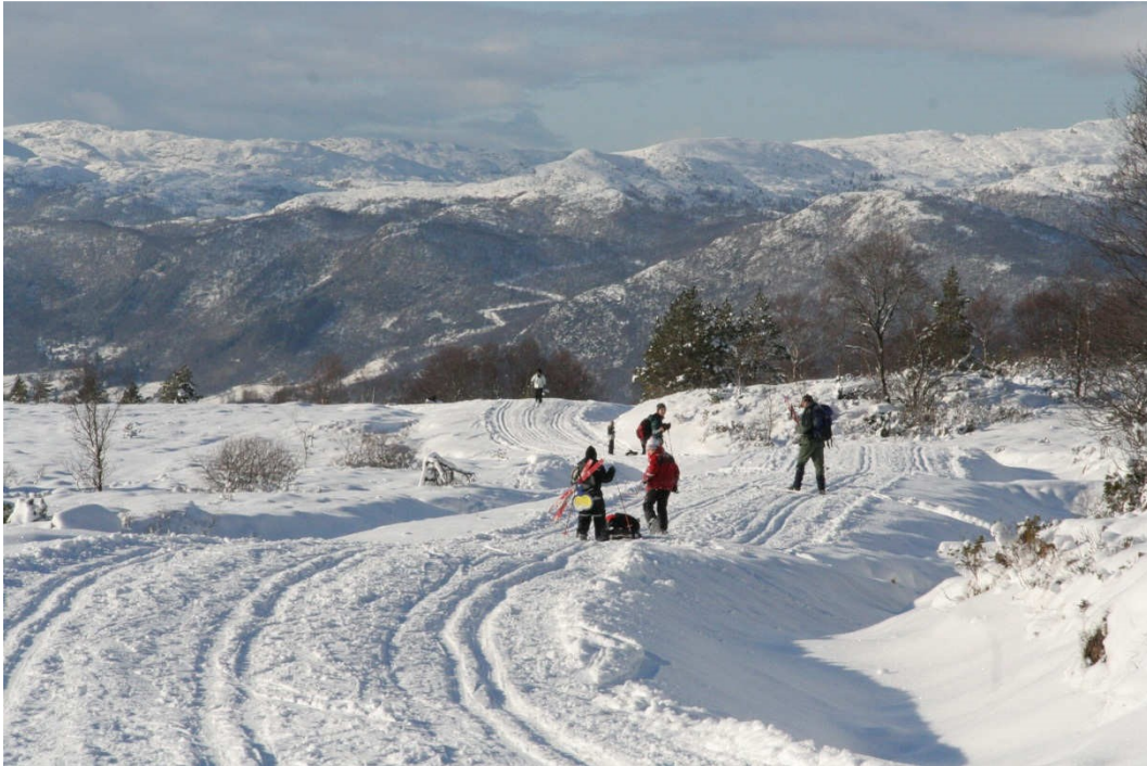
I Olalia har Friluftsrådet Vest ansvaret for kjøring av skiløyper