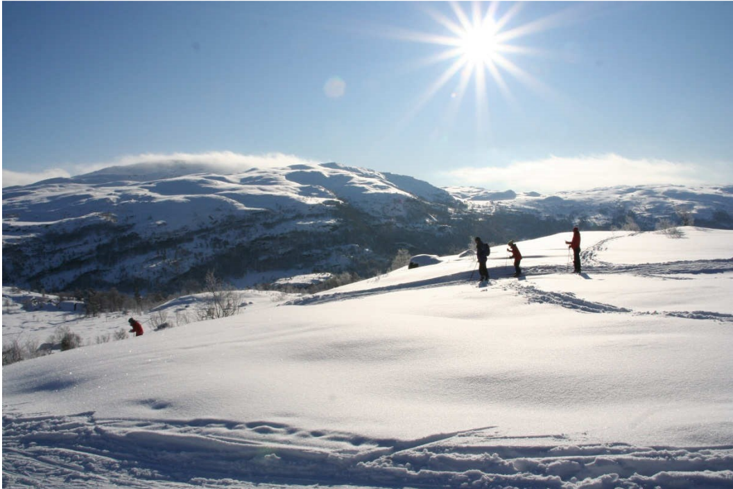
Olalia er hele Haugalandets eget vinterland