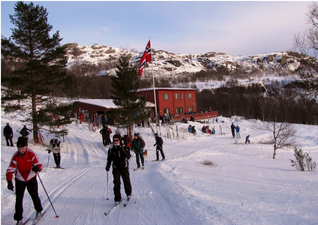
Sentralt i utfoldelsen av friluftsliv i Olali, sommer som vinter, ligger Olalihytta, drevet av Haugesund turistforening.