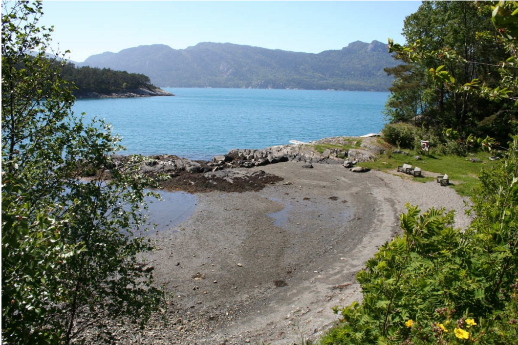
Intim og naturlig badestrand