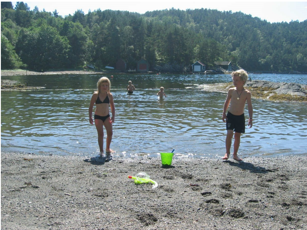
Langgrunn og populær blant de små