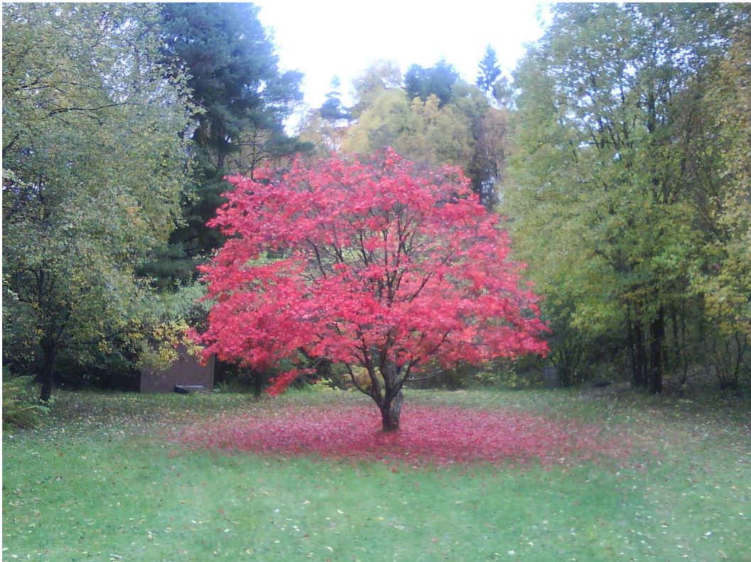
Ingen steder står blodbøken med så kraftige farger som her i Gardavika...