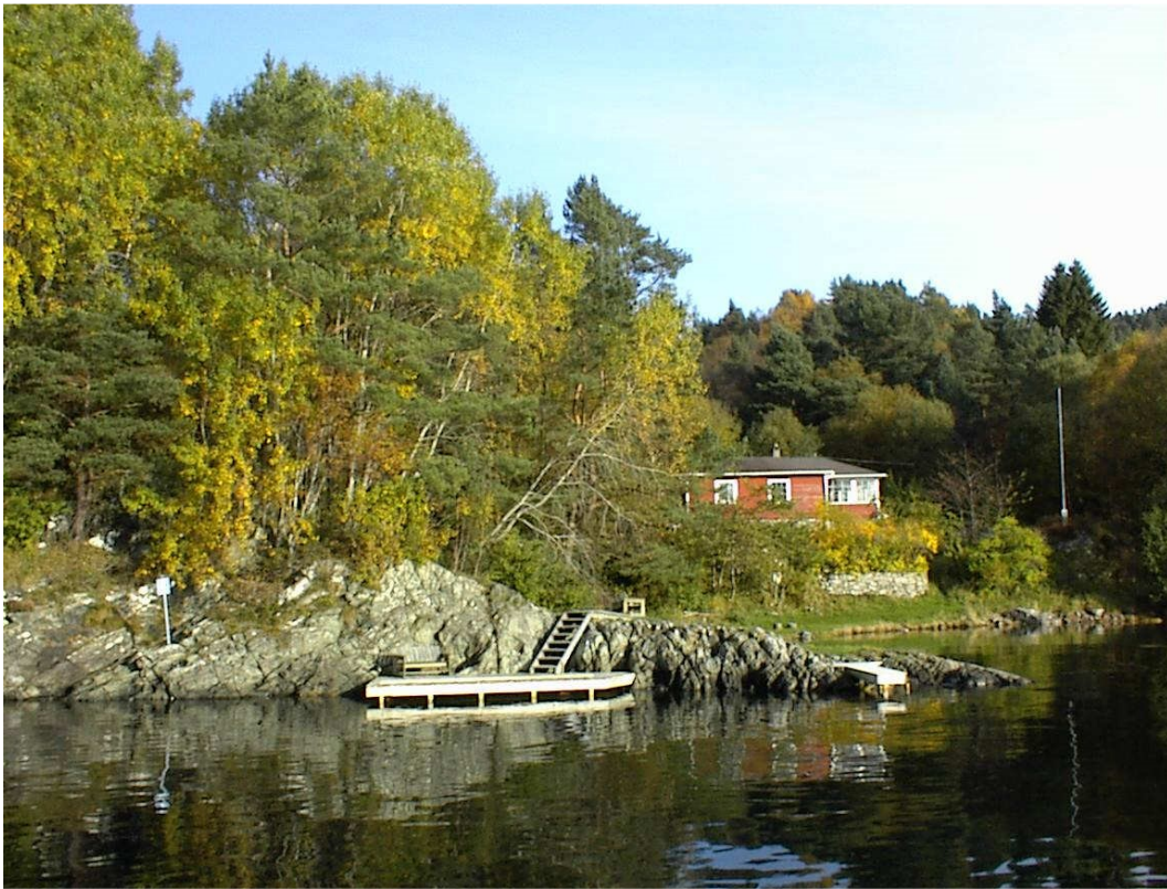
Trebrygga i forgrunnen og den tidligere private hytta med frukthagen i bakgrunnen