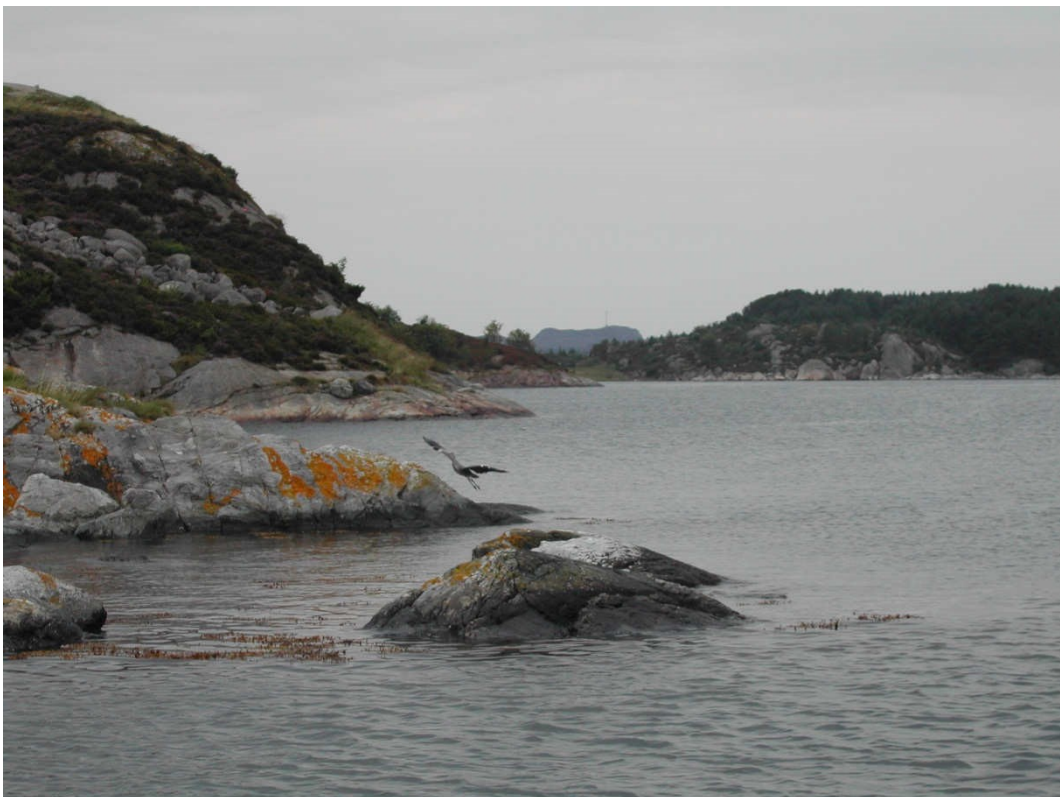
Parti fra Kobbavågen, nord på Austerøy