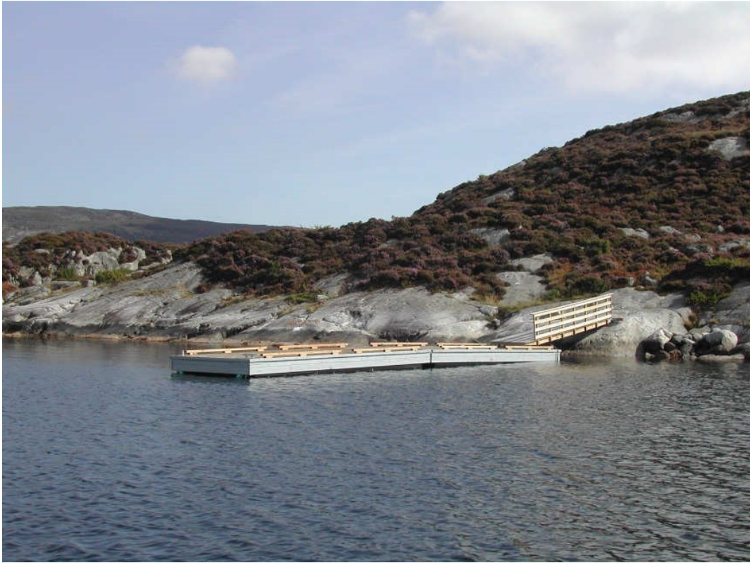
Stor, fin flytebrygge venter på båtfolket i Kobbavågen