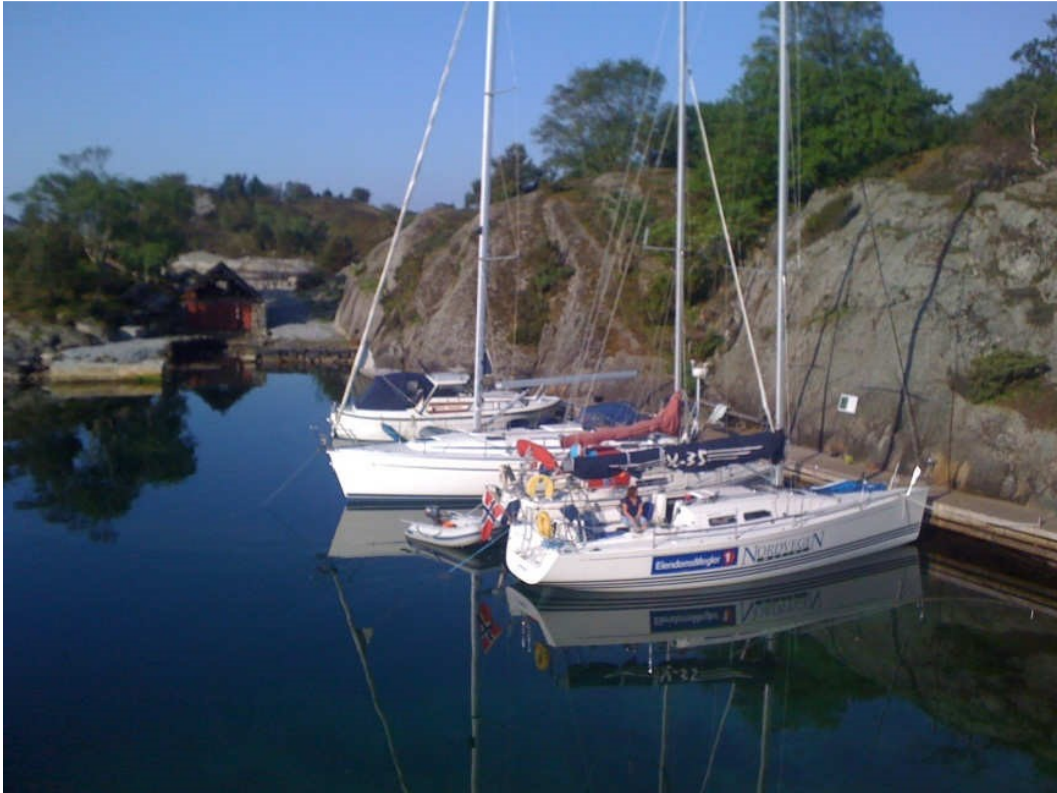
Gode fortøyningsforhold ved trebrygga på østsiden av øya