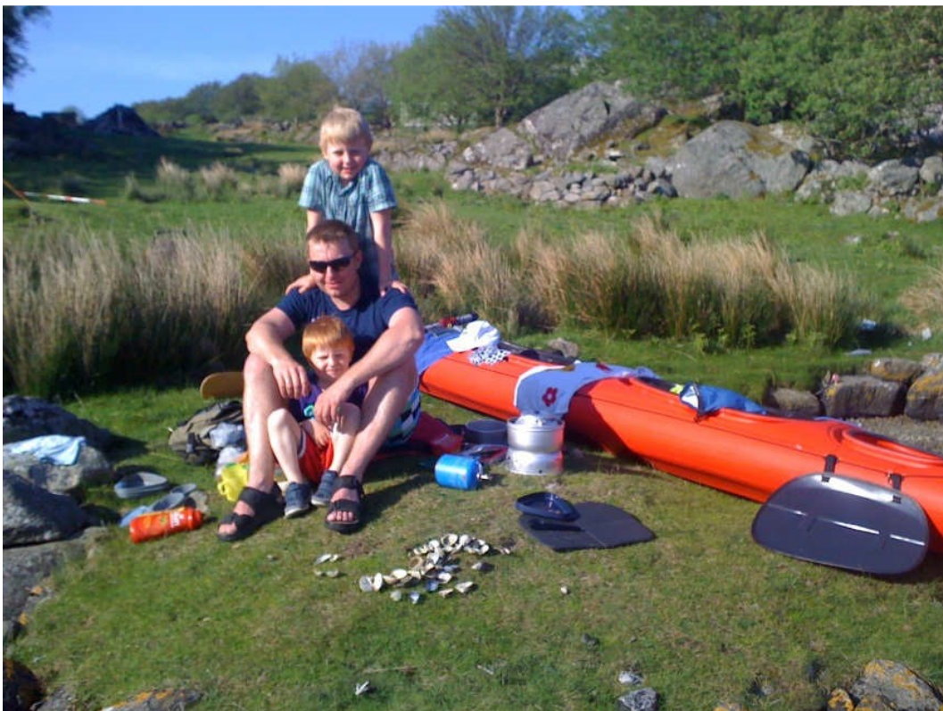
Far og to mindreårige sønner er innom Vesterøy på sin padleferie