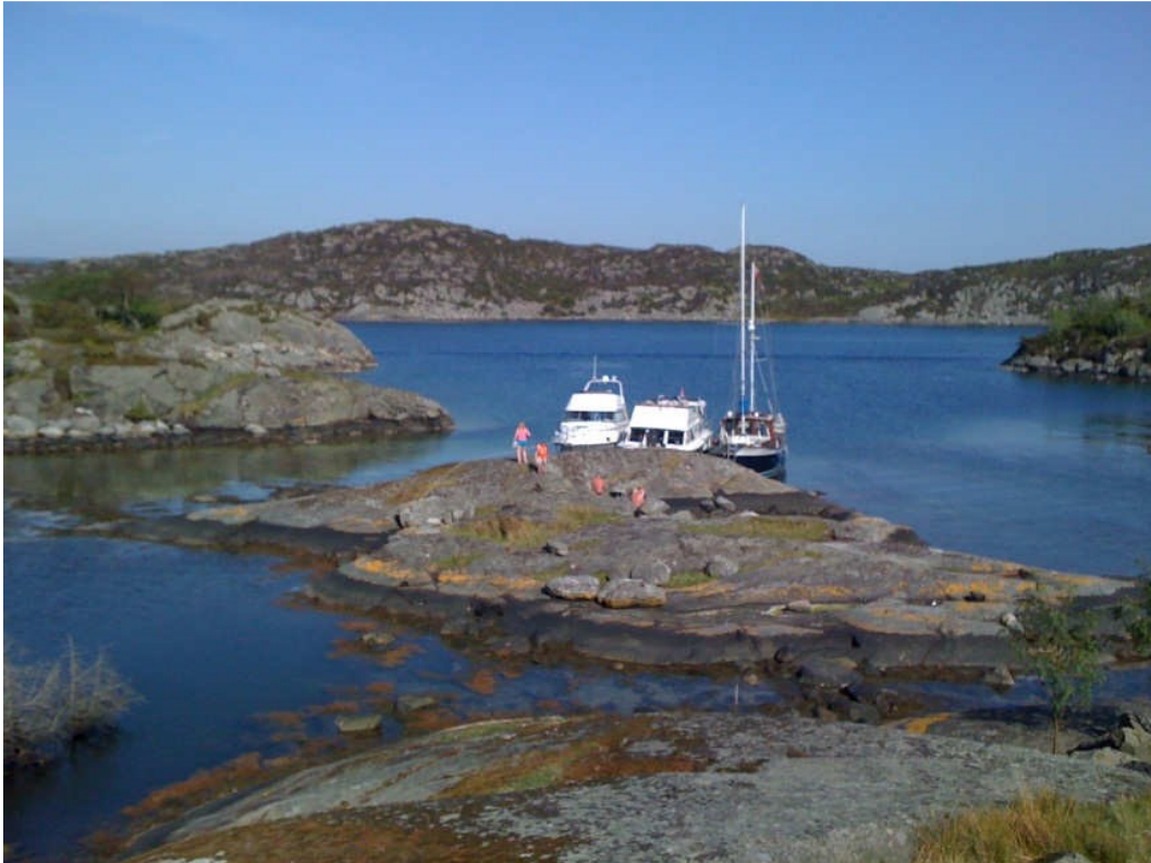
Fine svaberg på holmene sør for Vesterøy.