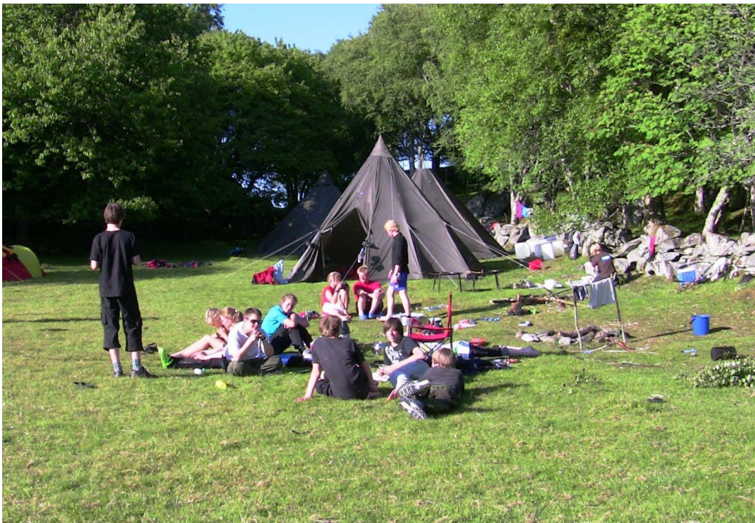
På Vesterøy arrangeres det årlig basecamp for ungdommer, med friluftaktiviteter både på land og sjø