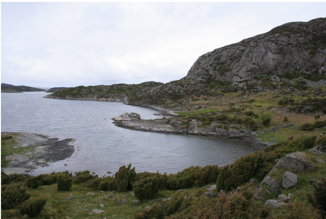
Mellom svabergområdene er det sand- og grusstrender.