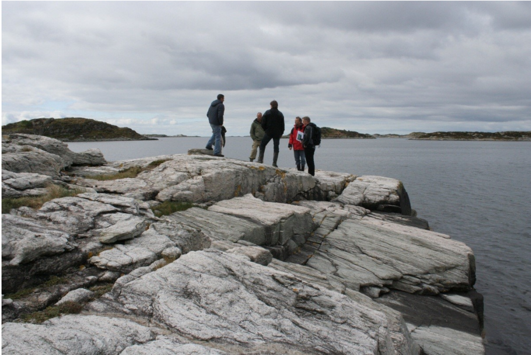
Spesielle formasjoner på svabergene i Steinsvikene på Are. Her kan besøkende fortøye rett på berget.