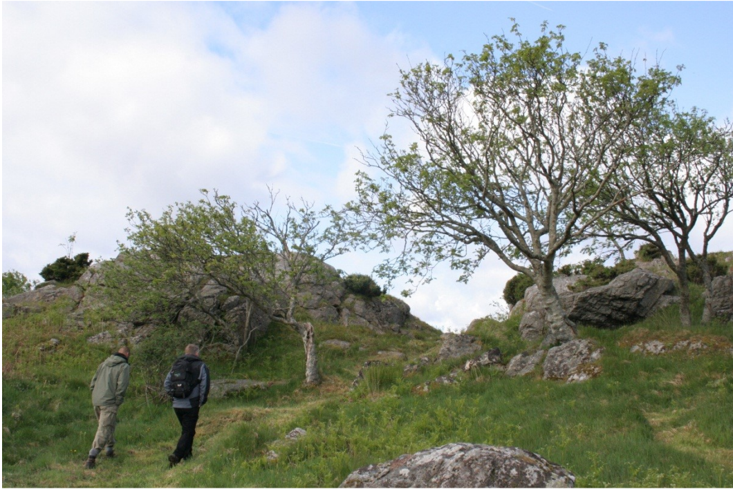
Friluftsområdet på Are innbyr til turer i gammelt kulturlandskap og kystlynghei