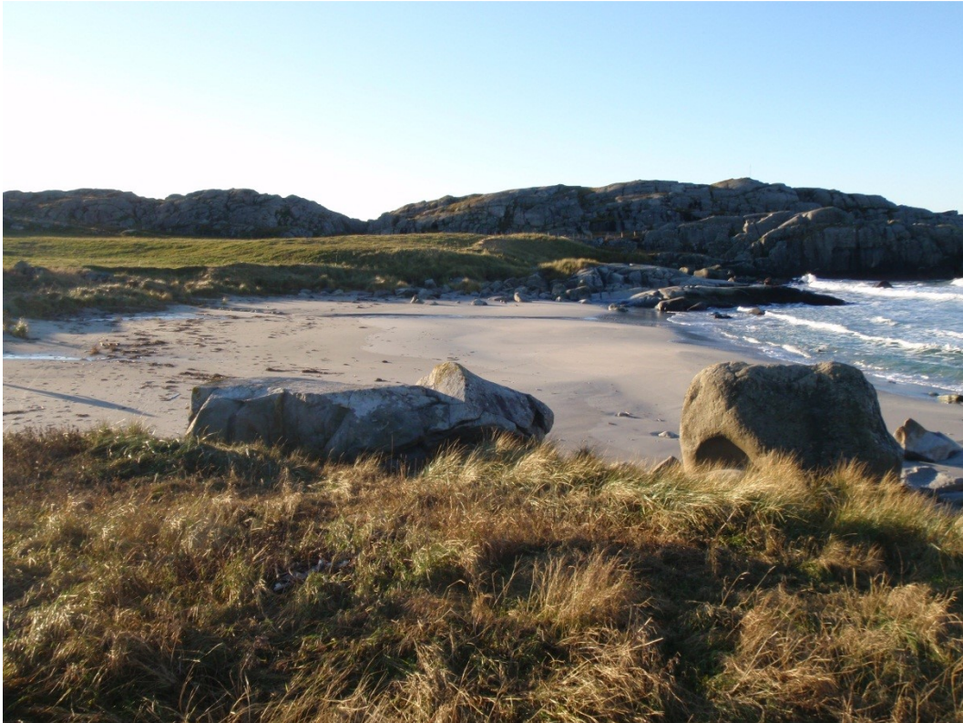
Mjølhussanden tilbyr idyll, finkornet sand og store bølger..