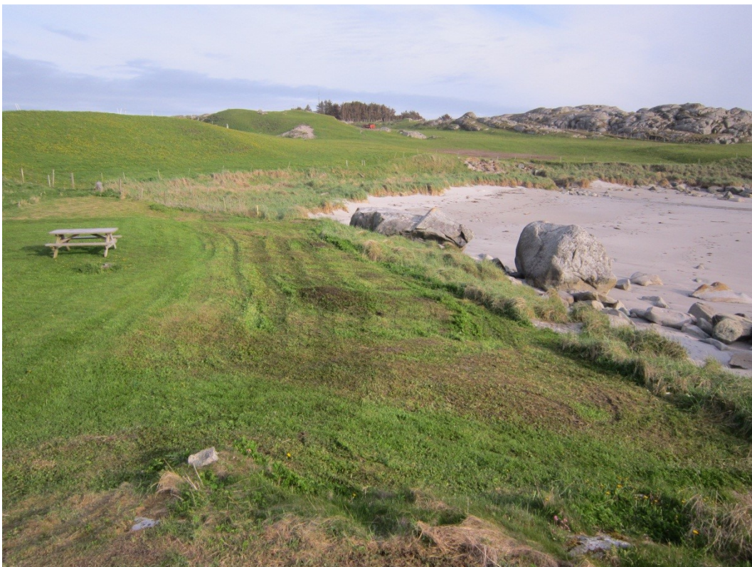
Noe av kulturbeitet ved stranda er satt av som rasteplass med bord, benker og søppelstativ.