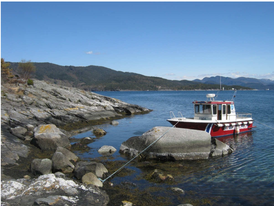
Skjærgårdstjenesten på vårrensk av strendene på Toftøy