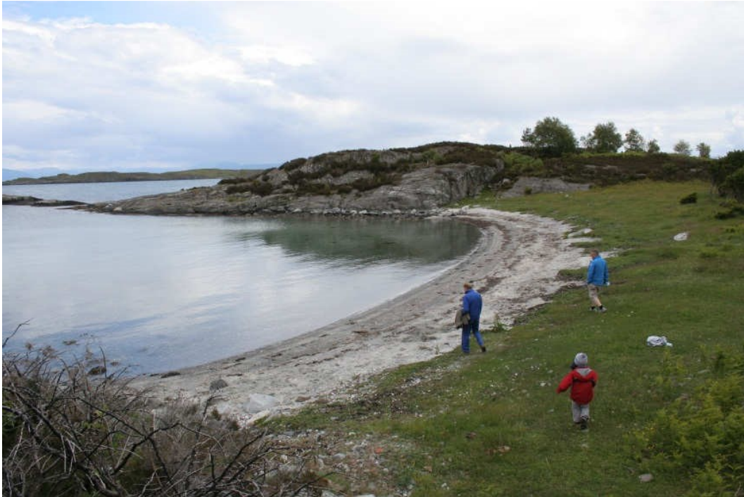
Stor og langgrunn sandstrand i Melevika i nord