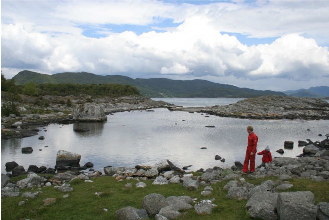
I Selvågen, på østsida av Toftøy, finner du en spennende lagune