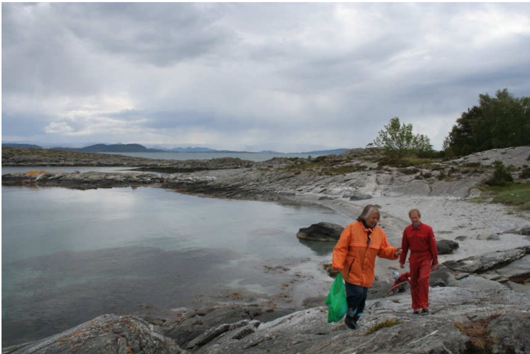
Fine, naturlige strander med hvit og finkornet skjellsand