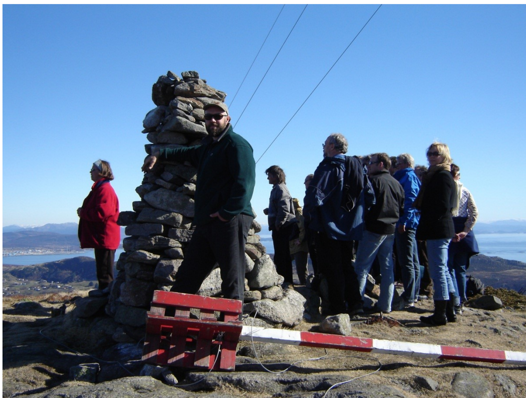
Ved varden på toppen av Boknafjellet er det i dag satt opp tematavler som forteller mye om Bokn og kommunene rundt synsranden