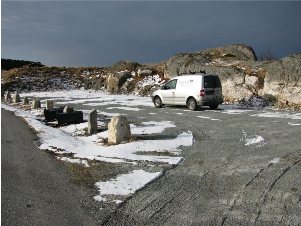
Friluftsrådet Vest har sikret et område ved foten av Boknafjellet, der det er anlagt parkeringsplass for omkring 20 biler.