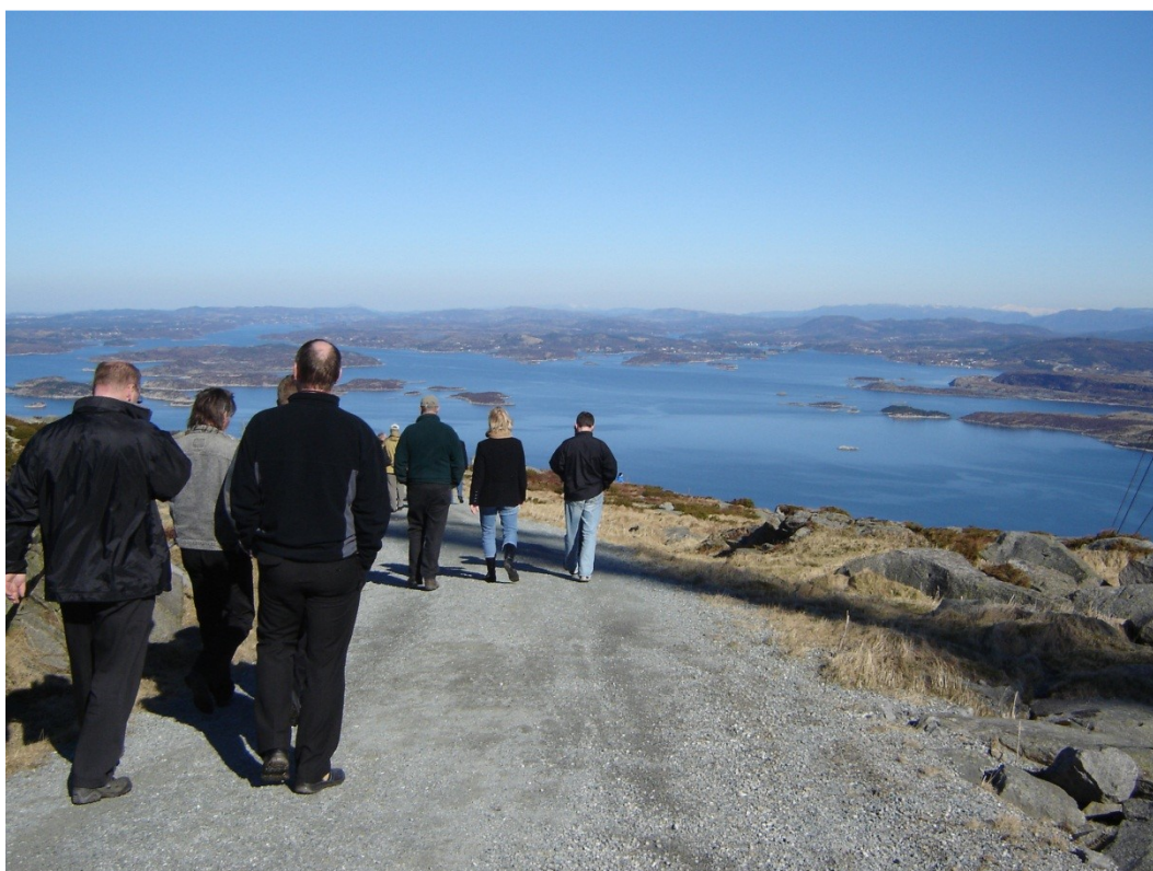
Fra Boknafjellet får du en fantastisk utsikt i alle himmelretninger, her nordover mot Tysvær og Haugesund.