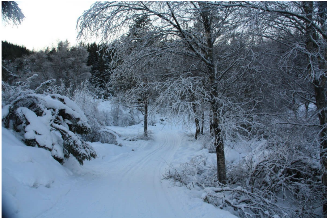
Nodland er et viktig turutgangspunkt, også vinterstid