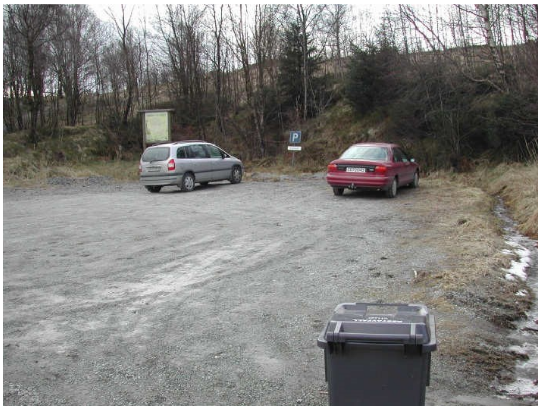
Parkeringsplassen på Nodland er utvidet og oppgradert etter at dette bildet ble tatt...