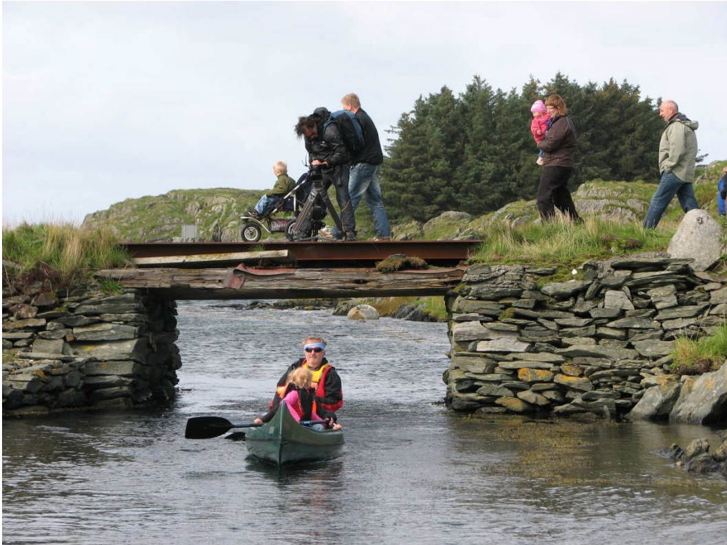
Vibrandsøy innbyr til friluftaktiviteter av mange forskjellige slag...