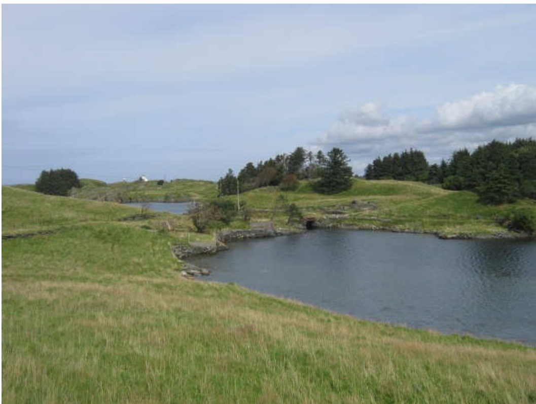
På Vibrandsøy dominerer gammelt kulturlandskap